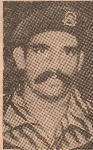
லூ. சார்ல்ஸ் அன்ரனி