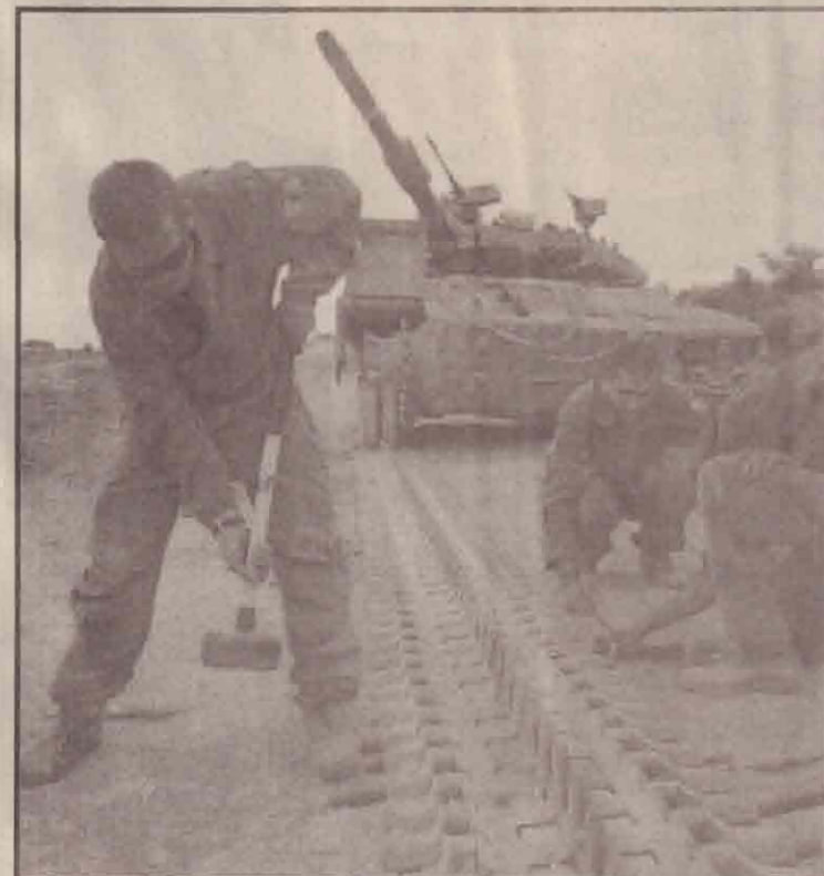
டாங்கியொன்றினைப் பழுது பார்க்கும் பணியில் ஈடுபட்டிருக்கும் இஸ்ரேலியப் படையினர்.

இதனையடுத்து மனித உரிமை அமைப்புகளின் வேண்டுகையின் பேரில் அமெரிக்காவும் பொது நலவாய அமைப்பும் ஐரோப்பிய ஒன்றியமும் சிம்பாப்வே மீது பிரயாணத் தடைகளையும் பொருளாதாரத் தடைகளையும் விதித்துள்ளன.