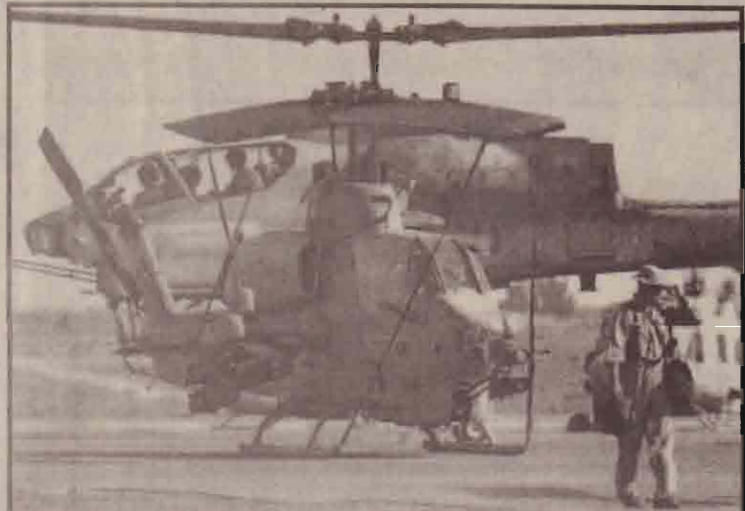
குவைத்தின் அலி அல்சலாம் வீமானப் படைத்தளத்தில் தரையிறங்கும் அமெரிக்க 'கோப்ரா' தாக்குதல் உடலங்குவானூர்திகள்.

இதேவேளை புதிய தீர்மானத்துக்கு அமெரிக்கா, பிரிட்டன், ஸ்பெயின், பல்கேரிய நாடுகள் ஆதரவு தெரிவித்துவரும் நிலையில் ஐப்பான், ரஷ்யா, பிரான்ஸ், சீனா, ஜேர்மனி, சிரியா என்பன கரும் எதிர்ப்புகளைத் தெரிவித்து வருகின்றன என்பது குறிப்பிடத்தக்கது.