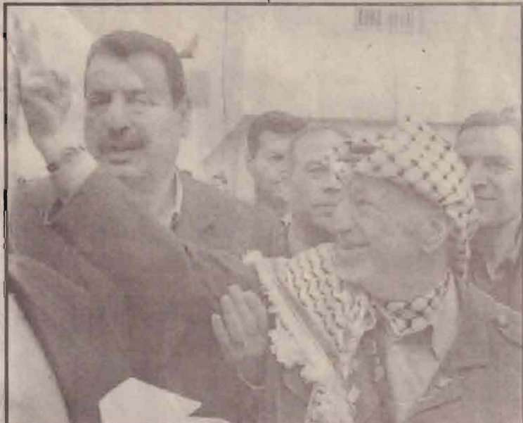
ரமள்ளா நகரில் இடம்பெற்ற பலஸ்தீன அதிகார சபைக் கூட்டத்தில் சனாதிபதி அரபாத்துடன் பிரதமராக பிரேரிக்கப்பட்டுள்ள அப்பாஸும் (இடது) காணப்படுகிறார்.

இதன்படி கிளர்ச்சிக் குழுக்களுக்கும் அமைச்சு பதவி உட்பட பல சலுகைகள் கிடைக்கவுள்ள நிலையில் அதனை குழப்பும் நடவடிக்கைகள் தொடர்ந்தும் இடம் பெற்று வருகின்றன.