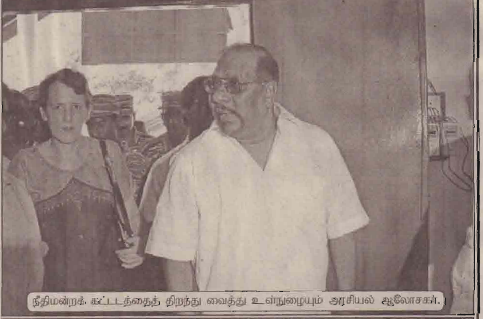
நீதிமன்றக் கட்டடத்தைத் திறந்து வைத்து உள்நுழையும் அரசியல் ஆலோசகர்.