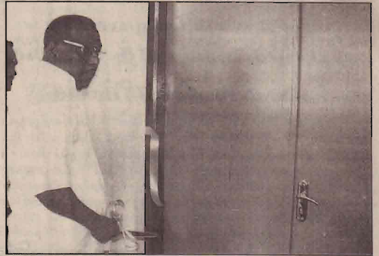
நதிமன்ற கட்டடத்தை நாடாளை வெட்டி அரசியல் ஆலோசகர் திறந்து வைப்பதைப் படத்தில் காணலாம்.

நாம் உயிரிழப்புக்களை சந்திக்க முடியாது. ஏனென்றால் ஒரு சட்டவிரோத சம்பவத்துடன் நிகழ்ந்த ஒரு பிரச்சினையாக இருந்தால் இதனை பொறுத்துக் கொள்ளலாம். (10 ஆம் பக்கம் பார்க்க)