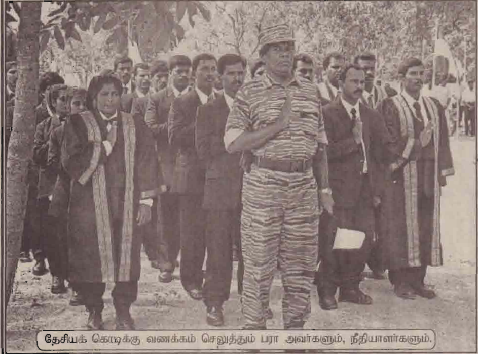
தேசியக் கொடிக்கு வணக்கம் செலுத்தும் பரா அவர்களும், நீதியாளர்களும்.