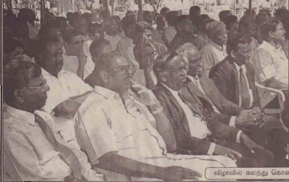
விழாவில் கலந்து கொண்டோரில் ஒரு பகுதியினர்.