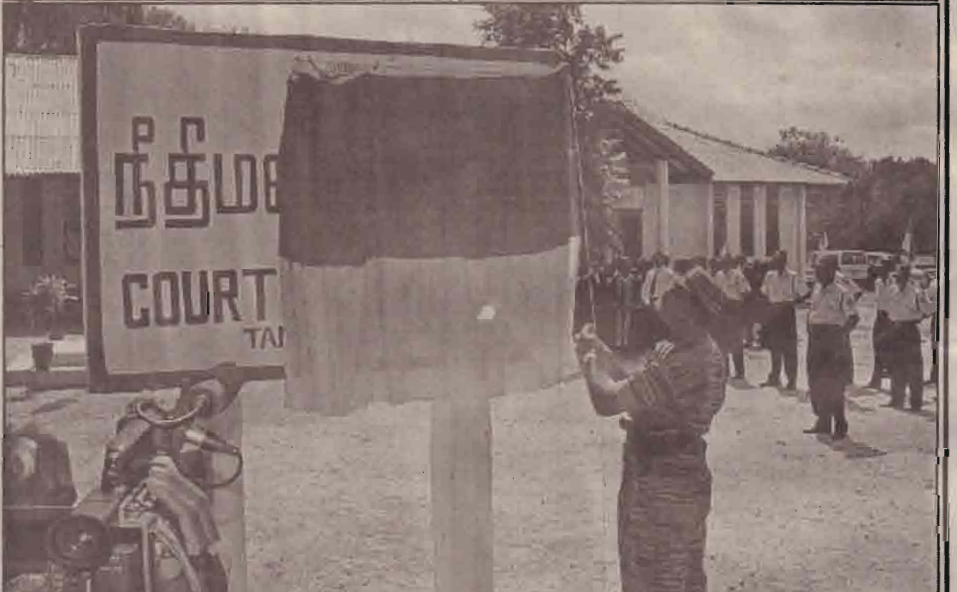
நீதிமன்ற வளாகப் பெயர்ப் பலகையை நிதித்துறைப் பொறுப்பாளர் திரைநீக்கம் செய்கிறார்.