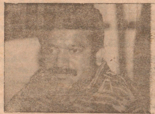
தற்புரியும் உள்ள ஒரு பகுதியாகவே தொடர்ந்தும் உள்ளது எனவே இவர்களைச் சம்பவங்களை குறிப்பாக பிரமதாசா காணச்சம்பவங்களையும் அவரது கொடூரமான படுகொலையின்

இதேவேளையில் வன்முறைகள் நாட்டின் நிலைமைகளுக்கு சிறிதும் கூடிக்குறைந்து ஒரு சக்கரப்போல சுற்றிக்கொண்டுள்ளது. ஒரு பக்கத்தில் பல பொருள்பெரும்படியான இவர்களை அரசாங்கத்தின் போக்கும் மறுபக்கத்தில் தனது அபிவிருத்திகளுக்காக விடுதலைப்புலிகளுடைய உறுதிப்பாடும் உள்ளது;