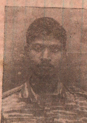
வீரவேங்கை ஆவுடையான் (ஆனந்தன்)