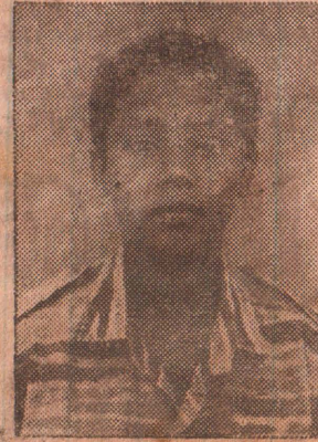
வீரவேங்கை துரோணன் (கோடிஸ்வரன்)