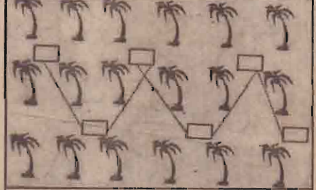
குறுகிய இடைத் தூரத்தில் நடுகை செய்யப்பட்ட தென்னை மரங்களுக்கிடையே, நான்கு தென்னைகளுக்கு நடுவில் குழிகளை அமைக்கலாம்.