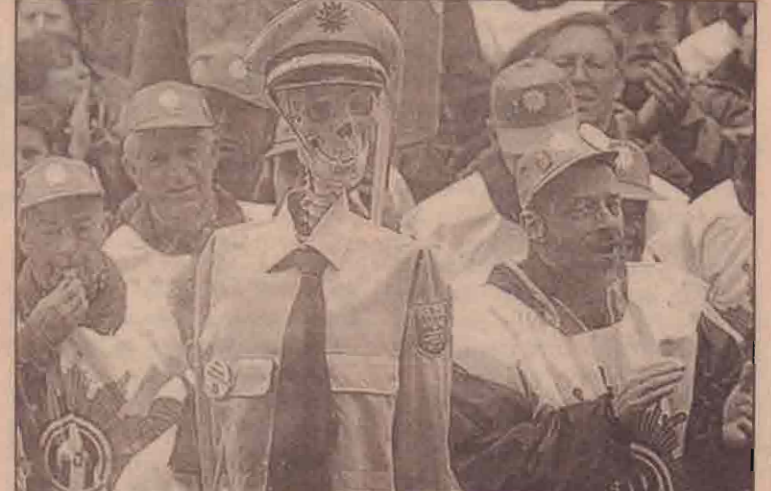
ஜெர்மனியில் வரவு செலவுத்திட்டத்தில் பொலிசாரின் சீருடைகளுக்கான நிதியை அரசு நீக்கி விட்டதால் ஆர்ப்பாட்டப் பேரணியில் இறங்கியுள்ள அந்நாட்டுப் பொலிசார்.

அயோத்தியில் பாபர்மசூதி இடிக்கப்பட்ட வழக்கில் அத்வானி மீது சதித்திட்டம் தீட்டியதான குற்றச்சாட்டை நீக்கிவிட்டு சி.பி.ஐ தயாரித்திருக்கும் குற்றப்பத்திரிகையின் இணைப்பை ஆதரிப்பதாகக் கூறப்படுவதை உத்தரப் பிரதேச முலாயம்சிங் அரசு மறுத்துள்ளது.