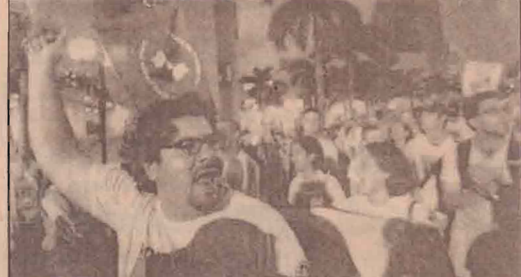
சுதந்திர வர்த்தக வலயம் அமைப்பது தொடர்பாக புளோரிடாவில் நடைபெறும் உச்சி மகாநாட்டைக் கண்டித்து ஆர்ப்பாட்டத்தில் ஈடுபட்டுள்ள அனைத்துலக ஆர்ப்பாட்டக்காரர்கள்.

தேயிலை வளம் நிறைந்த இம் மாநிலத்தில் லெப்ரி மாவட்ட கிரிக்கெட் அணிகளுக்கிடையிலான போட்டிகளைப் பார்வையிட்டவர்களே தீவிரவாதிகளின் தாக்குதலுக்கு இலக்காகியுள்ளமை குறிப்பிடத்தக்கது.