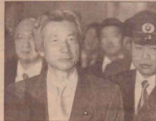
ஈராக்கை கட்டி யெழுப்பும் நடவடிக்கையைக் கைவிட்டு அமைதிப்படைகளை அனுப்புவது பற்றிய யப்பான் யோசனையை ஈரானின் நிலையில் மீண்டும் பிரதமராகத் தெரிவு செய்யப்பட்ட சட்ட சபைக்குள் நுழையும் பிரதமர் யுனிசிரோ கொய்சுமி.

பிரதமர் யுனிசிரோ கொய்சுமி கூறியுள்ளார். அல்ஹைதாவின் இவ் அச்சுறுத்தல் ஜப்பானின் பங்கு, மற்றும் அந்நியச் செலாவணி சந்தையிலும் எதிரொலித்துள்ளது.