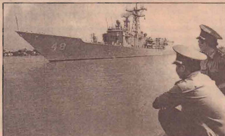
ஒத்துழைப்புடன் கூடிய ராணுவ சமநிலையை ஏற்படுத்தும் உடன்படிக்கை ஒன்றை ஏற்படுத்த வியட்நாம் - அமெரிக்க நாடுகள் முயற்சி எடுத்துள்ள நிலையில் சைகோன் (ஹோசியின்) துறைமுகம் நோக்கிச் செல்லும் அமெரிக்க போர்க்கப்பல்.