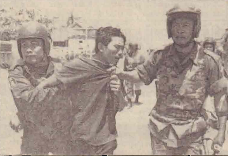
நோம்புனில் ஆர்ப்பாட்டக்காரர் ஒருவரைக் கைது செய்யும் கம்போடிய இராணுவப் பொலீஸர் அமெரிக்க இராணுவக் செயலர் கொலின் பவலின் வீஜயத்தைக் கண்டித்து ஆட்டைத் தொழிற்சாலை ஊழியர்கள் ஆர்ப்பாட்டத்தில் ஈடுபடுகின்றனர்.

இஸ்ரேலிய, பாலஸ்தீன அதி காரிகள் அமெரிக்காவின் வற்புறுத்தலின் பெயரில் நேற்று முன் தினம் உயர் மட்டப் பாதுகாப்பு பேச்சுவார்த்தைகளை மீண்டும் ஆரம்பித்துள்ளனர். கடந்த ஒரு வாரகாலமாக 50 பேரைப் பலி கொண்ட வன்செயல்கள் காரணமாக அமெரிக்கா முன்வைத்த சமாதானத் திட்டம் இடைநிறுத்தப்பட்டிருந்தமையைத் தொடர்ந்து, இரு தரப்பினரையும் மீண்டும் பேச்சுவார்த்தைகளை ஆரம்பிக்குமாறு அமெரிக்கா வற்புறுத்தியிருந்தது.