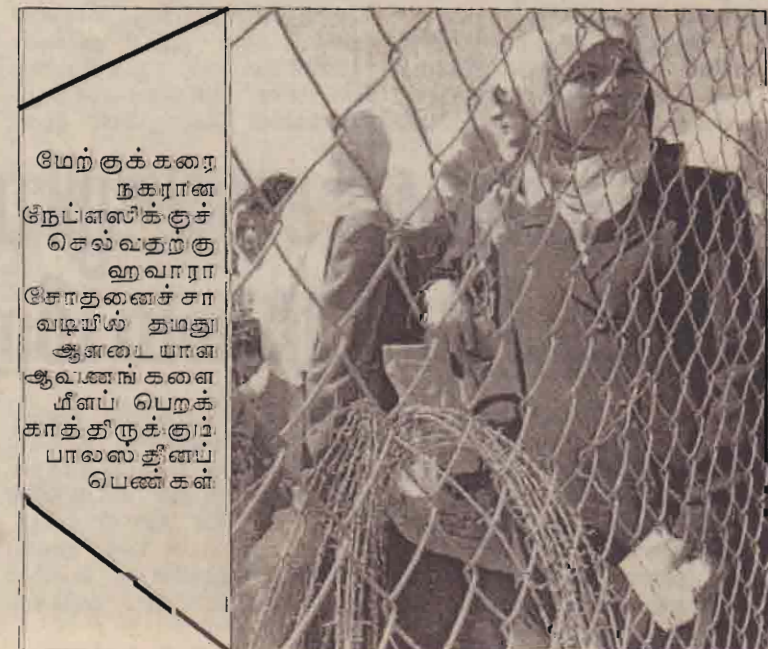
மேற்குக் கரை நகரான நேப்பீஸ்க்குச் செல்வதற்கு ஹவாரா சோதனைச் சாவடியில் தமது ஆளடையான ஆவணங்களை மீளப் பெறக்காத தீருக்குப் பாலஸ்தீனப் பெண்கள்

இந்தியா கூறியிருப்பது போல் பொருளாதார வர்த்தகத் துறைகளில் மேற்கொண்டு நடவடிக்கைகளுக்கு அவர் விரும்ப மின்மையும் தெரிவித்துள்ளார்.