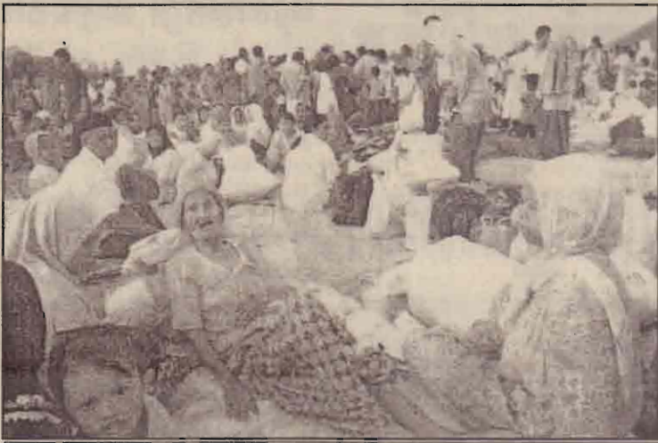
இந்தோசேசியாவில் இராணுவத் தாக்குதல்களால் இடம் பெயர்ந்துள்ள ஆஷே மாகாண மக்கள்