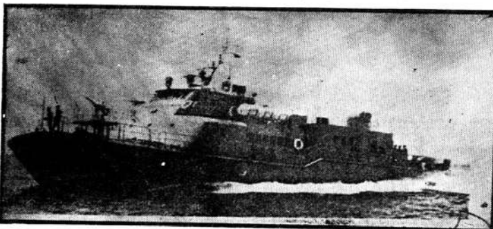
குறைந்தது 120 துருப்புக்களைக் காவியபடி, மணிக்கு 30 கடல் மைல் ( 55 கி. மீ. ) வேகத்தில் செல்லக்கூடிய வீரவுத் துருப்பேறிகள்.