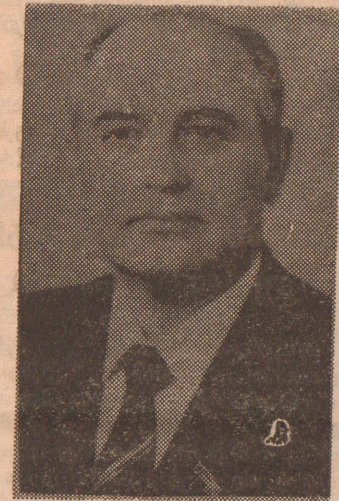
பதற்கான சூழ்நிலையை உருவாக்கி விடுதல் என்பதையே காட்டுகிறது எனலாம்.

பிரதம மந்திரியின் இவ்வாறான பேச்சானது ஐரோப்பா பாவில் தொடர்ந்தும் இராணுவத்தளங்களைவைத்திருப்பதற்கான சூழ்நிலையை உருவாக்கி விடுதல் என்பதையே காட்டுகிறது எனலாம்.