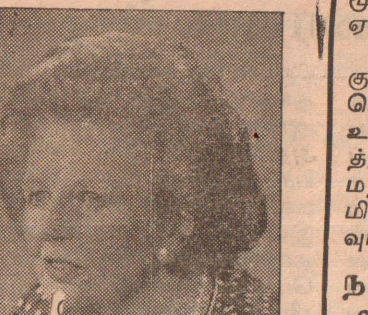
வேண்டுகோள் என்பதையே யாராலும் மறுக்க முடியாது. கடந்த வருடம் நிருபர்கள் மாநாட்டின்போது தட்சர் கூறிய கருத்தானது அவர் எவ்வளவு தூரம் அணுவாயத்தங்களையோ, இராணுவ பலத்தையோ விரும்புகிறார் என்பதைக் காட்டுகிறது.

“அணுவாயுதத்திற்கு அஞ்சித்தான் போர் நடைபெறுதுள்ளது. சமாதானத்தை நான் விரும்புகிறபடியால் அணு ஆயுதத்தையும் விரும்புகிறேன்” என்று கூறியமை