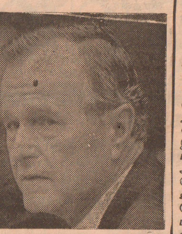
வேண்டுகோள் என்பதையே யாராலும் மறுக்க முடியாது. கடந்த வருடம் நிருபர்கள் மாநாட்டின்போது தட்சர் கூறிய கருத்தானது அவர் எவ்வளவு தூரம் அணுவாயத்தங்களையோ, இராணுவ பலத்தையோ விரும்புகிறார் என்பதைக் காட்டுகிறது.

ஆகவே மார்க்கிரிட் தட்சரின் இராணுவ தளங்களுக்கான ஒரு தேவையே இவ்