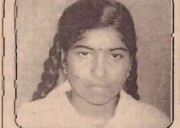
கடந்த டிசம்பர் மாதம் நடைபெற்ற க.பொ.த (சா/த) பரீட்சையில் கிளிநொச்சி புனித திரேசா (08ஆம் பக்கம் பார்க்க)