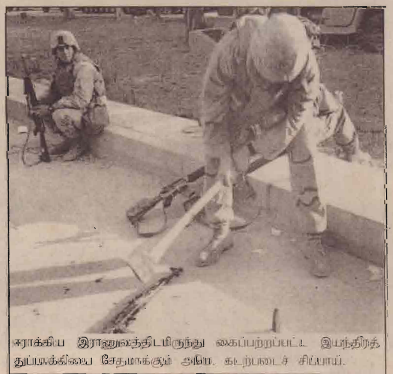
ஈராக்கிய இராணுவத்திடமிருந்து கைப்பற்றப்பட்ட இயந்திரத் துப்பாக்கியை சேதுமாக்கும் அமெ. கடற்படைச் சிப்பாய்.