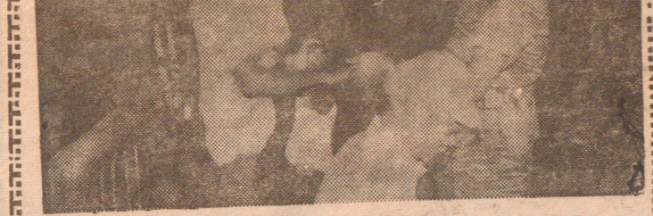
தமிழ்நாட்டின் பல பாகங்களிலும் தேவியைச் செல்லப்பா குழுவினரின் இசைநிகழ்ச்சிகள் நடைபெற்றன. சாவகச்சேரியில் நடந்த நிகழ்ச்சியில் கீத்தார் வாசித்த இளைஞனுக்கு பொறுப்பாளர்களுடைய புகழ்ச்சிகள் மோதிரம் அணிவித்துக் கொள்கிறபோது எடுத்த படம்

முடையதாகக் காணப்பட்டது. இம்மணலை ஒரு வகைக் காற்று மூடியுள்ளதாகவும்; அக்காற்று அசைவதனால்தான் இவ்வாறு பல்வேறுபட்ட ஓசைகள் கேட்பதாயும் அம்மணலைப்பற்றி ஆராய்ந்த விஞ்ஞானிகள் கருதுகின்றார்கள்.