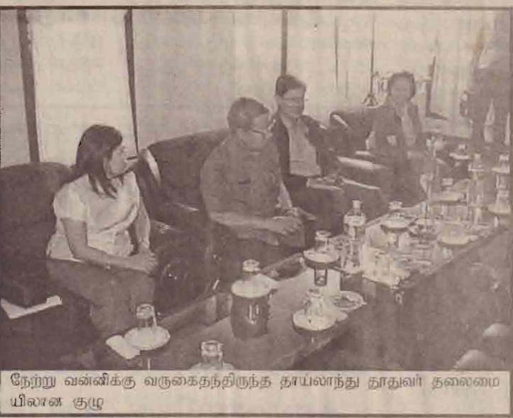
நேற்று வன்னிக்கு வருகைதந்திருந்த தாய்லாந்து தூதுவர் தலைமை யிலான குழு

தமிழீழ அரசியல் துறைப் பொறுப்பாளருடன் நேற்று கிளிநொச்சியில் இடம்பெற்ற சந்திப்பின் செய்தியாளர்களுக்கு கருத்துக் கூறும் போதே அவர்