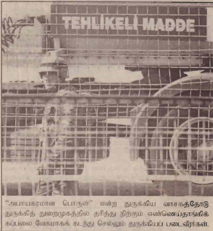
“அபாயகரமான பொருள்” என்ற துருக்கிய வாசகத்தோடு துருக்கித் துறைமுகத்தில் தரித்து நிற்கும் எண்ணெய்தாங்கிக் கப்பலை வேகமாகக் கடந்து செல்லும் துருக்கியப் படைவீரர்கள்.

மலைப் பகுதியில் சென்று கொண்டிருந்த இந்த ரயில் திடீரென மலைச்சரிவிற்குள் வீழ்ந்துள்ளது. மீட்புப் பணிகள் தொடரும் நிலையில் விபத்தில் உயிரிழந்தவர்களின் தொகை அதிகரிக்கலாம் என அதிகாரிகள் அச்சம் வெளியிட்டனர்.