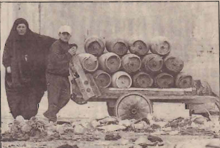
பக்தாத்தில் ஐ.நா. ஆயுதப் பரிசோதகர் பணியை யாப்த்துக்கொண்டு நிற்கும் ஈராக்கிய தாயும், மகனும்.

இதேவேளை இத்தகைய தாக்குதல்களைத் தவிர்ப்பது மிகவும் சுடிமான விடயம் என்று பிரிட்டன் அதிகாரிகளை மேற்கோள்காட்டி லண்டனில் வெளியாகும் “சண்டே டைம்ஸ்” தெரிவிக்கின்றது. மேலும் கப்பல்கள் மூலம் அணுவாயுதங்கள் பிரிட்டனுள் கொண்டுவரப்பட்டு தாக்குதல் நடத்தப்படக் கூடிய அபாயம் இருப்பதாகவும் அப்பத்திரிகை மேலும் தெரிவிக்கின்றது.