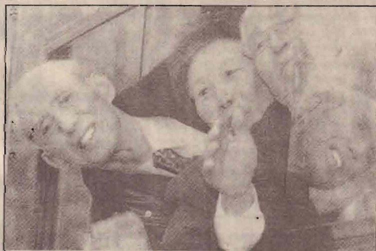
வடகொரியாவில் இசுக்கும் தமது உறவினர்களை 50 வருடங்களுக்குப் பின் சந்தித்துவிட்டு மீண்டும் தென்கொரியா செல்ல விடைபெறும் சூழலினர்.