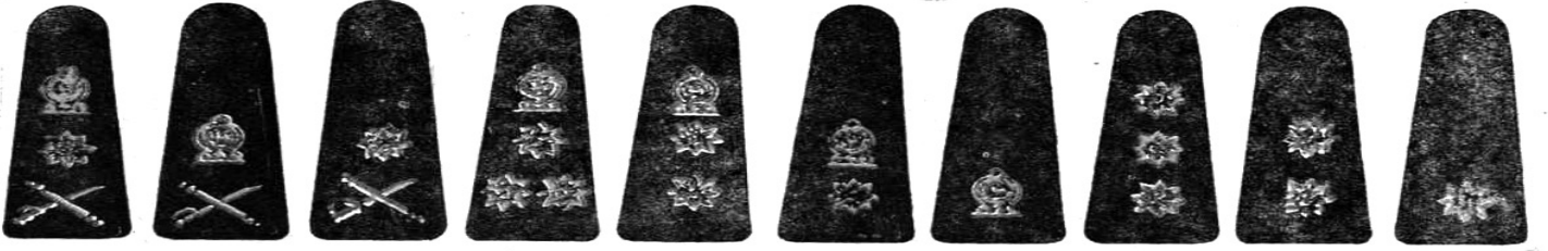
ஜெனரல் General லெப்டினன்ட் ஜெனரல் Lieutenant General மேஜர் ஜெனரல் Major General பிரிகேடியர் Brigadier கேணல் Colonel லெப்டினன்ட் கேணல் Lieutenant Colonel மேஜர் Major கப்டன் Captain லெப்டினன்ட் Lieutenant இரண்டாவது லெப்டினன்ட் 2nd Lieutenant