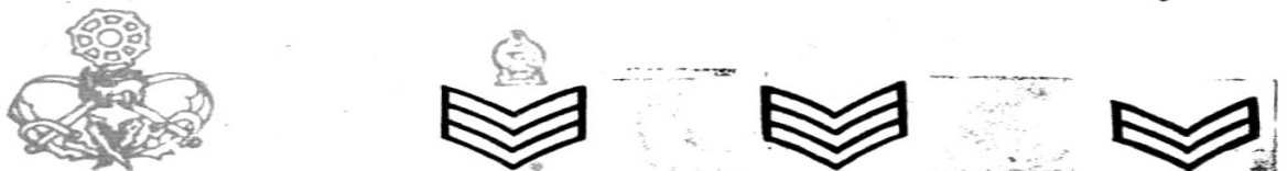
வாரன்ட் ஓஃபிசர் Warrant Officer பிளைட் சார்ஜன்ட் Flight Sergeant சார்ஜன்ட் Sergeant கோபரல் Corporal