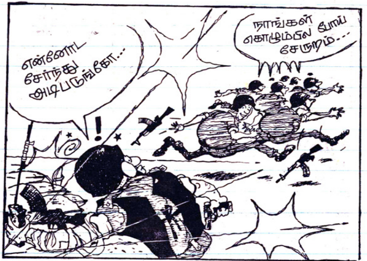
செய்தி: - படையிலிருந்து ஓடியவர்கள், கொழும்பில் திரும்பவும் வந்து சேரலாம் என இராணுவ அதிகாரி ஒருவர் கூறியுள்ளார்.

தமிழீழ விடுதலைப்புலிகளின் அடிகாரசூர்வ ஏடு