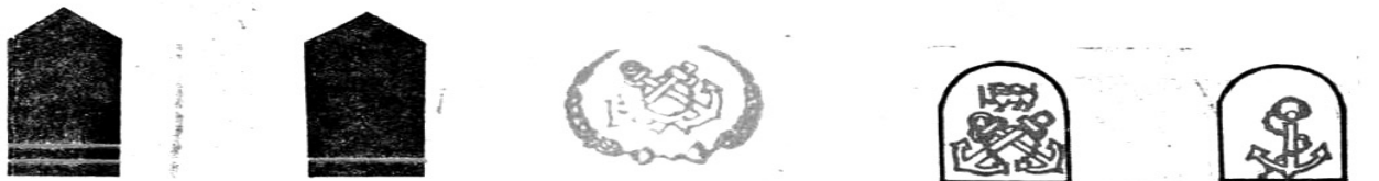
மாஸ்டர் சீப் பெற்றி ஓஃபிசர் Master Chief Petty Officer பிளீட் சீப் பெற்றி ஓஃபிசர் Fleet Chief Petty Officer சீப் பெற்றி ஓஃபிசர் Chief Petty Officer பெற்றி ஓஃபிசர் Petty Officer லீடிங் சீமன் Leading Seaman