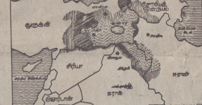
குர்திஷ் இன மக்களின் குடிசனப்பரம்பல் (சென்னை வட்டம்)

மன்னரால் தகர்த்தெறியப்பட்டது முன்னா முஸ்தாபா பர்ஷாணி (Mulla Mustaba Barzani) வட சராக்கிலிருந்து ஒரு சிறிய குர்திஷ் படை யுடன் சராக்கைத் தாக்கினார். ஆனால் சராக்கியப்படை ஆங்கிலேயர்கள் கைப்பொம்மை யாக இதை சராக்கிய மன்னரை 1958 இல் தூக்கி எறித்ததும் முஸ்தாபா பர்ஷாணி வட சராக்கிற்கு திரும்பிவிட்டார்.