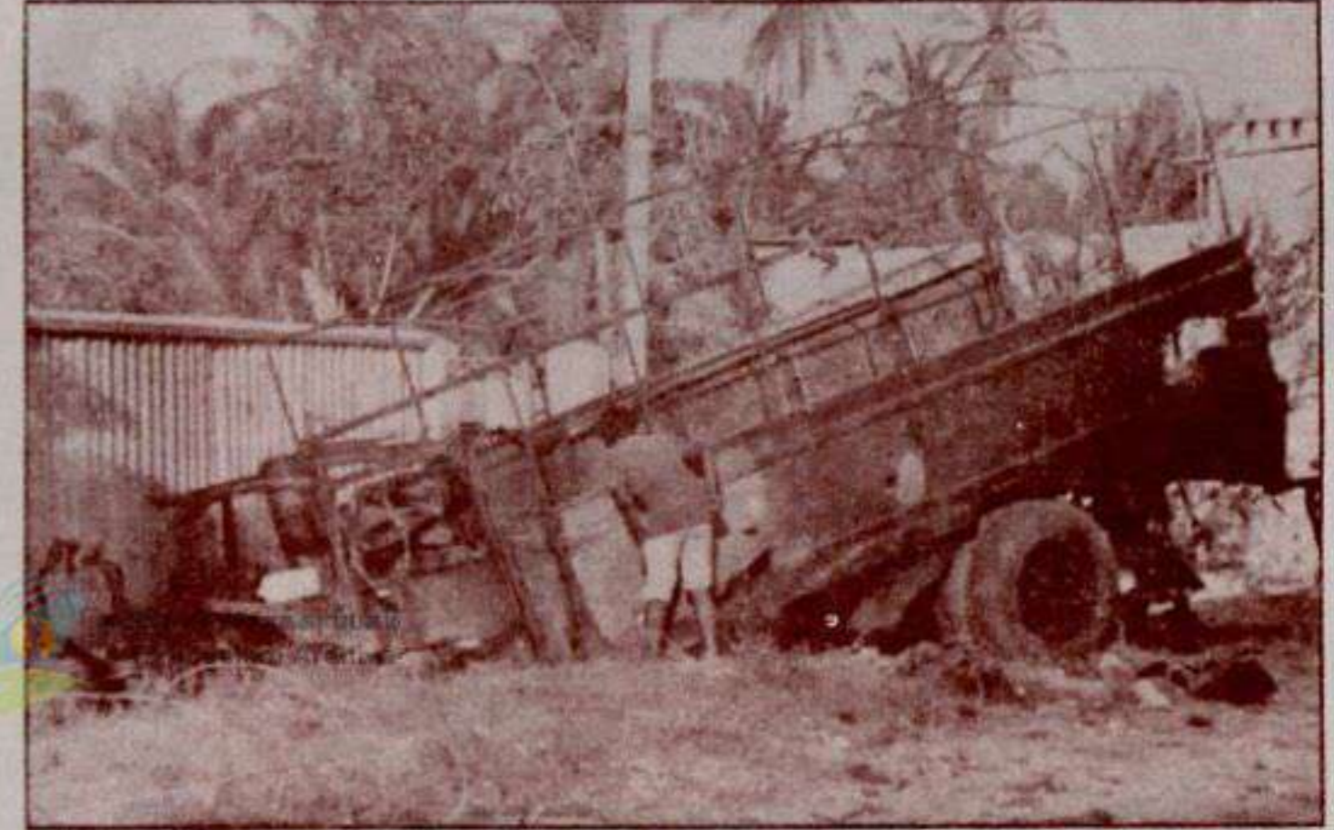
அழிக்கப்பட்ட இராணுவ வண்டி

இராணுவ வாகனம் தகர்க்கப்பட்டது 15 இராணுவத்தினர் கொல்லப்பட்டனர்