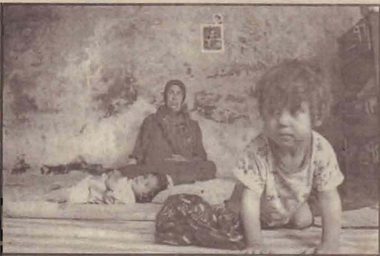
பாக்தாத் நகரில் போக்குவரத்து பொலீசரின் தலைமையகத்தில் வாடகைக்கு குடியிருக்கும் ஒரு தாய் கமது பிள்ளைகளை பராமரிக்கின்றார். (இக்கட்டம் சென்றமாத முற்பகுதியில் தீயினால் சேதமடைந்தது)

கவிழ்க்கப்பட்டார். ஆனால், பேரழிவு ஆயுதங்கள் எதுவும் கண்டு பிடிக்கப்படவில்லை என்பது குறிப்பிடத்தக்கது.