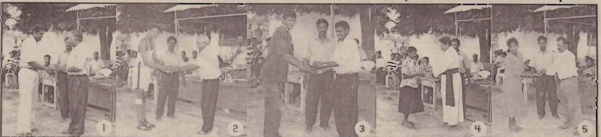
அணிகளில் நடைபெற்று முடிந்த கிளிநொச்சி மாவட்ட பிரதேச செயலக பிர்வுகளுக்கிடையிலான மெய்வல்லுநர் போட்டிகளில் சாதனை வீரர்கள் பரிசீலகளைப் பெற்றுக்கொள்வதைப் படங்களில் காணலாம்.