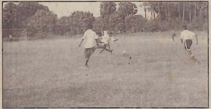
கிளிநொச்சி ம.வி.இந்துக்கல்லூரி அணிகளின் அரையிறுதி ஆட்டத்தின்போது.

கரைச்சி கோட்ட பாடசாலைகளுக்கிடையிலான பெரு விளையாட்டுப் போட்டிகள் நேற்று ஆரம்பமாகி நடைபெற்றுவருகின்றன. இதில் உருத்திரபுரம் மகாவித்தியாலய மைதானத்தில் நடைபெற்ற உதைபந்தாட்டப் போட்டியில் 19 வயதுப் பிரிவில் அரையிறுதிப் போட்டிகள் நேற்று நடைபெற்றன. இறுதிப்போட்டி இன்று நடைபெறவுள்ளது. இத்துடன் பெண்களுக்கான கர்ப்பந்து, வலைப்பந்து போட்டிகள் கனகபுரம் ம.வி.யிலும், ஆண்களுக்கான கர்ப்பந்து கிளி. பாரதி வித்தியாலயத்திலும் நேற்று ஆரம்பமாகி இன்று இறுதிப்போட்டிகள் நடைபெறவுள்ளன. இதேவேளை, இருபாலாருக்குமான கபடி கிளி. மத்திய கல்லூரியிலும் எல்லே, கிரிக்கெட், செஸ் போட்டிகள் கிளி. இந்துக்கல்லூரியிலும் நடைபெறவுள்ளன. இப் போட்டிகள் வரும் செவ்வாய்க்கிழமை ஆரம்பமாகும் என்று தெரிவிக்கப்படுகிறது.