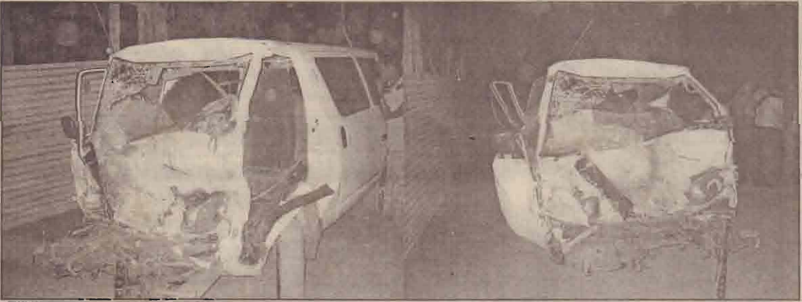
விபத்தில் பலத்த சேதமடைந்த கைஞஸ் வாகனத்தைப் படங்களில் காணலாம்.

கொண்டு செல்லப்பட்டு அங்கு மரணமானார். இவரது சடலம் வவுனியா மருத்துவமனை பிரேத அறையில் வைக்கப்பட்டுள்ளது. (10ஆம் பக்கம் பார்க்க)