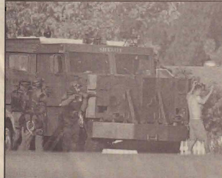
கலிபோர்னியாவில் தபால் அலுவலகத்துள் புகுந்து தபால் அதிபரையும் ஊழியர் இருவரையும் பணயக் கைதிகளாகப் பிடித்த குப்பாக்கீதார் அமைதியாக சரணடைகிறார்.