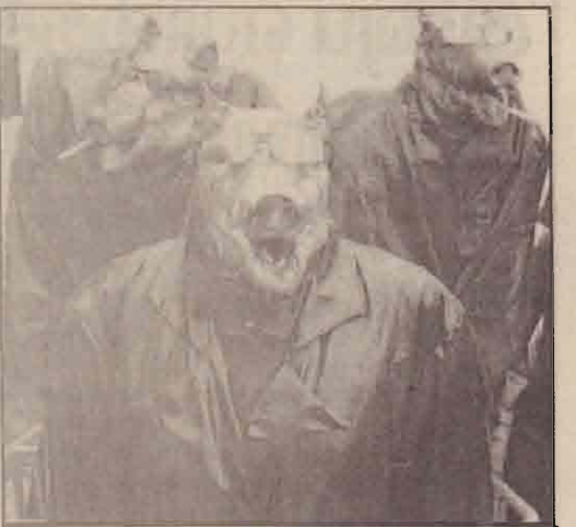
பிலிப்பைன்ஸின் மணிலாவுக்குத் தெற்கே பாலயன்நகரில் மதக் கொண்டாட்டத்தின் போது பாரம்பரிய உடை அணிவிக்கப்பட்டு காட்சிக்கு வைக்கப்பட்ட தீயில் வாடப்பட்ட பன்றிகள்