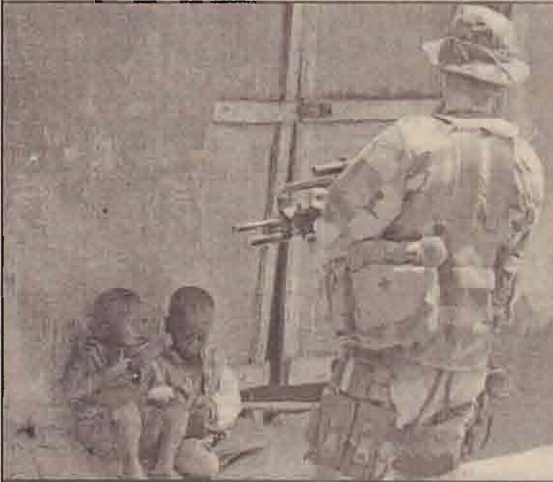
கொங்கோவில் பணியா நகரில் இரண்டு சிறுவர்கள் மாம்பழம் உண்பதை பார்த்துக் கொண்டு செல்லும் பிரான்சிய ரோந்துப் படை வீரர்.

பாசிஸ்தானுக்கு அமெரிக்கா வழங்கவிருக்கும் 300 கோடி டொலர் உதவியைத் தடுத்தால், அந்நாட்டிற்கு எவ்-16ரக விமானங்கள் வழங்குவது இடம் பெறாது என்றும் அவர் கூறியுள்ளார்.