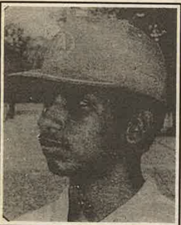
15 வயதிற்குட்பட்ட கிரிக்கெட் சுற்றுப் போட்டியில் இதுவரையில் பெறப்பட்டுள்ள ஒரேயொரு

டியில் ஆட்டமிழக்காமல் 113 ஓட்டங்களைப் பெற்றிருக்கிறார். மிகுந்த கூச்சத்துடன் புன்சிரிப்பு மாறாமல் உரையாடும் இவர், 06.04.1979 ல் பிறந்தவர். இவ்வருடம் 15 வயதுக்குட்பட்ட அணியில் இவர் ஆடுவது இரண்டாவது ஆண்டாகும். வலது கைத் துடுப்பாட்ட வீரராகிய இவர், அணியில் அறிமுகமாகியது ஆரம்பத்துடுப்பாட்ட வீரராகவாகும். இம்முறை இவர் யாழ்ப்பாணக் கல்லூரிக்கு எதிராக 66 ஓட்டங்கள் பெற்றமையும் குறிப்பிடத்தக்கது. இவரது பயிற்றுநரின் ஆலோசனையின் படி, ஆரம்பத் துடுப்பாட்ட வரிசையில் இருந்து தன்னை 7 ம் இலக்க மத்திய வரிசை ஆட்டக் காரராக மாற்றிக் கொண்டார். அதன் பின்பே 113 மற்றும் 66 ஓட்டங்களைப் பெற்றுக்கொள்ள