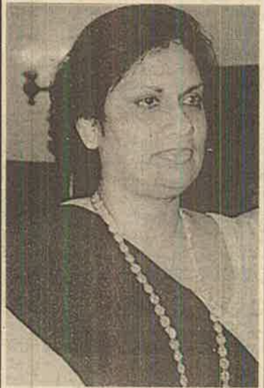
அமுலுக்கு வரவேண்டும். தமிழீழ மக்களின் பாரம்பரியத் தாயகம் மீதான பூரண உரிமை தமிழீழ மக்களுக்கு இருக்க வேண்டும். தமிழீழ மக்களின் பாதுகாப்பு, சட்டம், ஒழுங்கு பேணும் நிர்வாக முறை தமிழீழ

இன்னும் ஒரு படி செல்வோம். நடைமுறையில் தீர்வு என்பதற்கான வழி முறைகள் எப்படி அமைய முடியும்? அரசியலமைப்பில் மாற்றம் ஏற்படுத்தப்பட வேண்டும். ஒற்றையாட்சி அரசியலமைப்பு முறைக்குப் பதிலாக, பூரண அதிகாரங்களைக் கொண்ட கூட்டாட்சி முறை