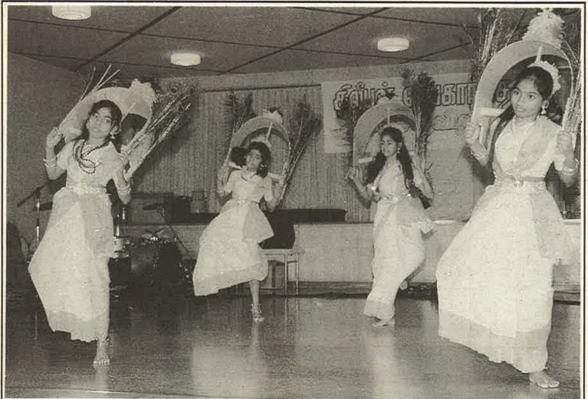
17.09.1994 சனிக்கிழமையன்று சுவீசில் நடாத்தப்பட்ட திலீபன் ஞாபகார்த்த எழுச்சிவிழாவில் இடம்பெற்ற கலை வடிவங்களில் ஒன்று.

பெற்ற பேச்சுக்களும் திலீபன் அவர்களின், தமிழ் விடுதலைப் போராட்டத்திற்கான அர்ப்பணிப்புக்களையும், தியாகத்தினையும் வெளிப்படுத்தி நின்றன. அத்துடன், இவ்வெழுச்சி விழா நிகழ்வுகள் யாவும், விழாக் காண வந்த எம்மக்களின் விடுதலை உணர்வுக்கு மேலும் உரமூட்டு வதாகவும் இருந்துள்ளன. ■