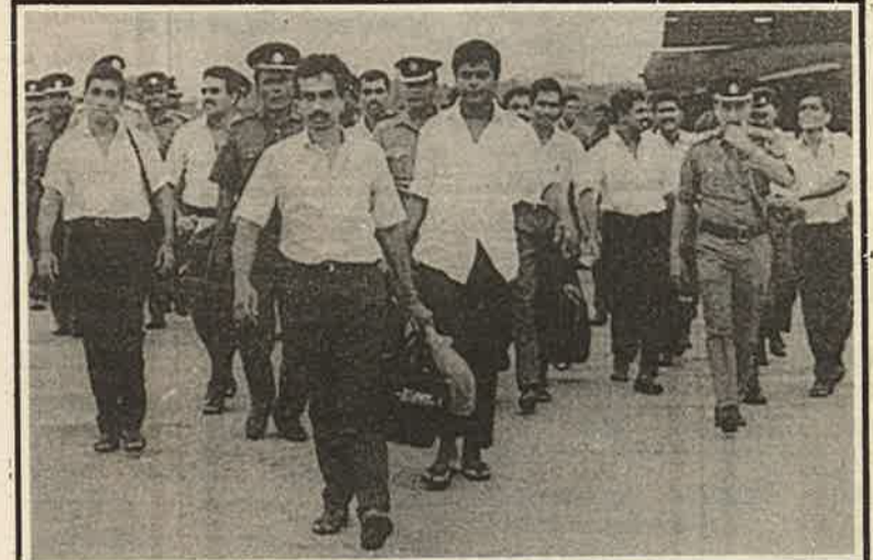
விடுதலைப் புலிகளின் தழும்புகாவலில் இருந்து விடுதலையான 10 சிறீலங்காப் பொலிஸரும் இரத்தமான விமானவலயத்தில் வந்திருக்கிறார்கள்...

ரவதை செய்யவில்லை. இந்த அர்த்தமற்ற யுத்தத்தை நிறுத்தி, நம் சகோதரர்கள் உயிரிழப்பதை நாம் இனிமேலாவது தவிர்த்துக் கொள்ளவேண்டும்" என்றார். ■