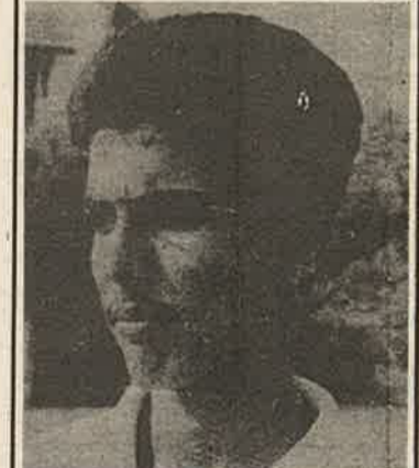
துடுப்பாட்ட வீரராவார். தொடக்க ஆட்டக்காரர் நலிவுறும் போது அந்த இடத்தை

வலது கைத்துடுப்பாட்ட வீரராகிய இவர் அணியின் 3ம் இலக்க