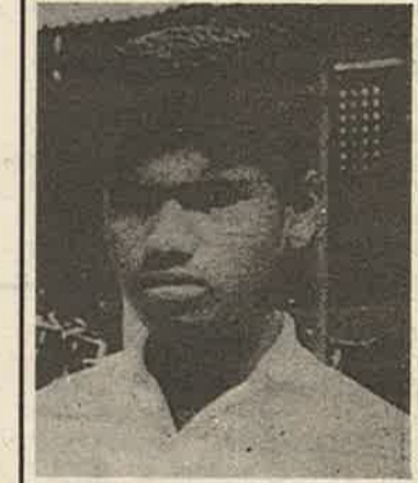
எனதொரு நிலையைக் காட்டுவதாகும். இந்நிலையில் பெறப்படும் சதங்கள் மிகுந்த கவனத்துக்குரியவை. இம்முறை தமது

இவர், அணியின் 3 -ம் இலக்க துடுப்பாட்ட வீரர் ஆவார். இந்த வரிசை ஏறத்தாழ ஆரம்பத் துடுப்பாட்ட வீரரின் கடமையைத் தன்னகத்தே கொண்ட கடினமான