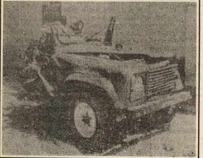
அராலிக் கண்ணிவெடியில் சிக்கிய லான்ட்ரோவர்.