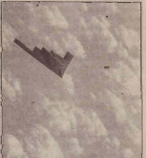
தாக்குதலுக்கான இலகளை குறிவைக்கும் அமெரிக்காவின் 3-புக் விமானம்.

இதில் 1 கோடி டொலர்கள் உலக சுகாதார ஸ்தாபனத் திற்கும், 80 இலட்சம் டொலர்கள் ஐக்கிய நாடுகள் சிறுவர் நிதியத் திற்கும் வழங்கப்பட்டுள்ளன.