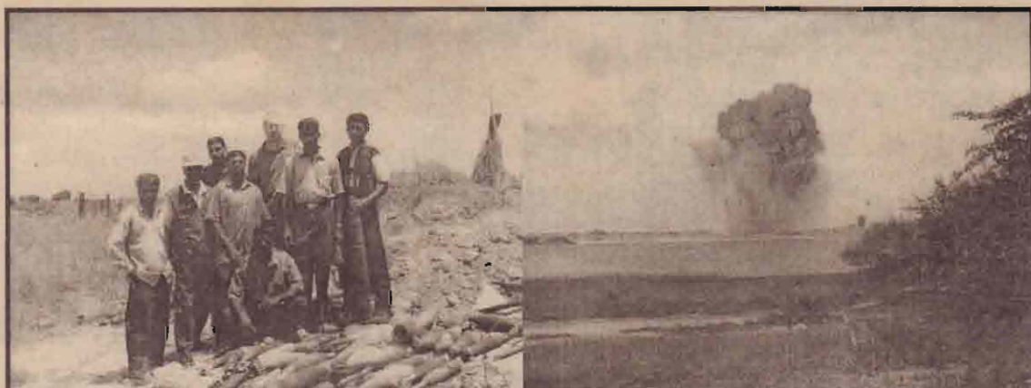
மீட்கப்பட்ட வெடிவொருட்களுடன் மனிதநேய கண்ணீர்வெடி அகற்றும் ரிர்வின் விசேட பயிற்சிபெற்ற அணியினரையும் அவை ஆணையரவில் தகர்த்துக்கொடுவதையும் காண்க. (யா)

கைக்கு எதிர்ப்புத் தெரிவிப்பதற்காகவும் சனநாயகத்தைப் பாதுகாக்க நடவடிக்கை எடுப்பதற்காகவும் இந்தக் கூட்டமைப்பை உருவாக்கி இருப்பதாகத் தொழிற்சங்க வட்டாரங்கள் தெரிவித்துள்ளன.