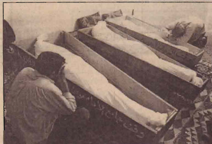
அமெரிக்காவின் குண்டுத்தாக்குதலில் கொல்லப்பட்ட ஈராக்மீதுள்ள சடலங்கள்.

இதேபோன்று கனகராயன் குளம் பகுதியில் நெல் ஏற்றிக் கொண்டு வவுனியா நோக்கிச் சென்று கொண்டிருந்த பாரவூர்தி ஒன்று தடம்புரண்டுள்ளது. இதில் சாரதி காலில் காயமடைந்துள்ளார். (டா)