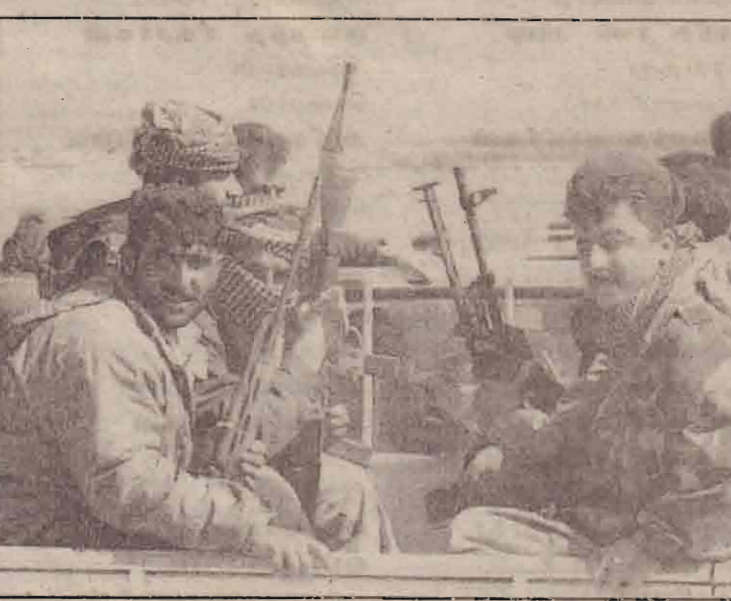
வட ஈராக்கில் குர்திஷ் இன மக்களின் கிரகுகப் பகுதியிலிருந்து ஈராக் படைகள் வெளியேறிய பின் அய்யகுதிக்குச் செல்லும் குர்திஷ் போராளிகள்.