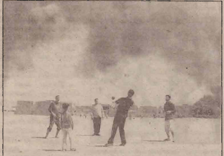
பாக்தாத்தில் தீப்பற்றியெரியும் எண்ணெய் வயலொன்றின் முன்பாக உதைபந்தாட்டம் விளையாடும் இளைஞர்கள்.

எனினும் முழுமையான வெற்றி கிடைக்கும்வரை போர் ஓயாது என சனாதிபதி புஷ் கூறியுள்ளார்.