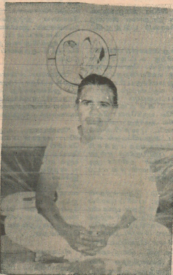
புங்குடுதிவு - நயினாதீவு - பலநோ. கூ. சங்கம்

அன்னை நூபதி ஆகுதி ஆனது கேட்டு இந்து மாகடல் பொங்கி எழுந்தது வங்கத்துப் புயல்காற்று சீறிச்சினந்தது வானத்து மேகங்கள் கதறி அழுகது வையகம் மீதினில் அன்னையின் தியாகம் வரலாறு படைத்தது.