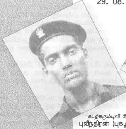
கடற்கரும்புலி மேஜர் புவிந்திரன் (புகழரசன்)