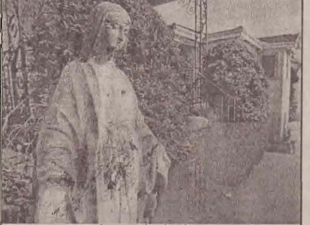
சுறாவளிவால் பாதிக்கப்பட்ட லூசியானா, நியூ ஒர்லியன்ஸ் நகரில் அமைந்துள்ள புனிதயோர் சீலையின் தோற்றம்.

நவாஸ் ஷெரீபும் மக்களின் பணத்தைக் கொள்ளையடித்துச் சென்ற அவர்கள் மீண்டும் நாட்டுக்கு திருப்பமுடியாது. அரசியலில் ஈடுபட அனுமதிக்கவும் மாட்டோம். பெனாசீர் பூட்டே தற்போது ஜெனீவாவில் தங்கியிருக்கின்றார். பிரதமராக இருந்த போது சட்டவிரோத பணப்பரிமாற்றத்தில் ஈடுபட்டது தொடர்பாக சுவீஸ் நீதிமன்றில் ஆஜராகி வருகிறார். தன்னைக் காப்பாற்றிக் கொள்ள முடியாத இக்கட்டான நிலையில் தவிக்கிறார். நாடு கடத்தப்பட்ட ஷெரீப் தற்போது ஜெட்டாவில் உள்ளார். எனினும் பெனாசீரின் பாகிஸ்தான் மக்கள் கட்சி மற்றும் நவாஸ் ஷெரீப் பின் முஸ்லிம் லீக் கட்சி ஆகிய இரு கட்சிகளும் 2007இல் நடைபெறவுள்ள பொதுத்தேர்தலில் போட்டியிட எந்தத்தடையும் இல்லை இவ்வாறு முஷாரப் கூறினார்.