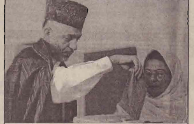
கடந்த 30 வருடகாலமாக நடைபெற்று வந்த கொடிய யுத்தத்தின் பின்னர் நேற்று முன்தினம் ஆப்கானிஸ்தானில் நடைபெற்ற பொதுத்தேர்தலின் போது தனது வாக்குச்சீட்டைப் பெட்டிக்குள் இரும்பு சண்டிப்பை ஊமிட்ட ஹாசாய்.

நடவடிக்கை தொடங்கியுள்ளது. அமெரிக்கக் கடலோர காவல்படையினர் கூறுகையில்; கற்றிணா சுறாவளிக்குப் பின்னர் லூசியானா மாகாணத்தில் ஆறு முக்கிய எண்ணெய்க் கசிவுகள் தவிர்த்தப்பட்டன. மிசிசிப்பி நதியில் நேரடியாக அவை கலப்பது தவிர்க்கப்பட்டது. நியூஒர்லியன்ஸ் கிழக்குப் பகுதியில் மர்பி எண்ணெய் கப்பலிக்குச் சொந்தமான சுத்திகரிப்பு நிலையம் உட்பட பல்வேறு இடங்களில் ஒரு இலட்சத்து 60 ஆயிரம் பெரல் எண்ணெய்க் கசிவு இருந்தது. அவற்றில் 50 ஆயிரம் பெரல்கள் மீட்கப்பட்டன." எனத் தெரிவித்தனர்.