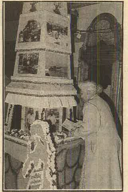
கடமை இருப்பதையும் நினைவுட்டக்கூடிய வகையில் நெறிப்படுத்தப்பட்டிருந்தது.

'விடியலின் சுவடுகள்' என்ற நாடகம், மண்ணை-மக்களை - போராடிகளை நேசிக்க வேண்டிய தேவையையும் ஒவ்வொரு தமிழ் மகனுக்கும் மகளுக்கும் ஏதோ ஒரு வகையில் போராட்டத்தில் பங்கெடுக்க வேண்டிய