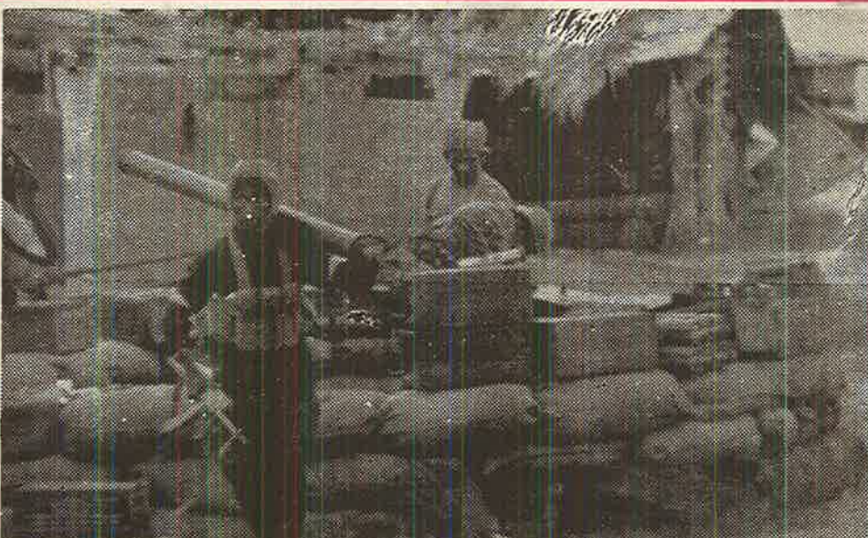
பூநகரி முகாமைத் தகர்த்த பின்னர் அங்கிருந்த கனரக ஆயுதமொன்றை எடுத்துச்செல்லும் போராளி ஒருவர்.

இத்தாக்குதலில் இராணுவத்தினருக்கு ஏற்பட்ட பெரும் உயிரிழப்பு போடு, இரண்டு இராணுவ பட்டாலியன்களைச் சிதைத்தது மட்டுமல்ல பெருமளவு ஆயுதத் தளபாடங்களையும் விடுதலைப் புலிகளுக்கு கொடுத்துள்ளது. இது சுமார் 25 கோடி ரூபாய்க்கு மேற்பட்டதாகக் கருதப்படுகின்ற இவ் இராணுவத் தளபாடங்கள் சிறீலங்கா இராணுவத்தின் ஒரு பட்டாலியனுக்குத் தேவையான சகல விதமான ஆயுதத் தளபாடங்களையும் கொண்டது என அறிய முடிகின்றது. இதில் பலரக கனரக ஆயுதங்களும் அடங்கியுள்ளன.