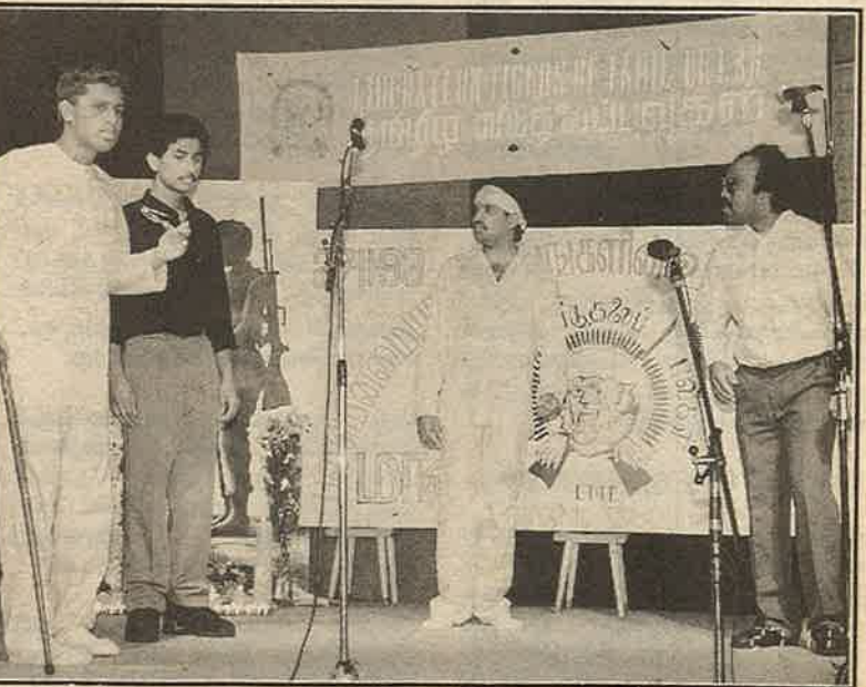
நெதர்லாந்தில் நடைபெற்ற மாவீரர் நாள் நிகழ்ச்சியின்போது இடம்பெற்ற நாடகத்தில் ஒரு காட்சி