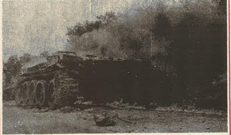
பூநகரி முகாம் தகர்ப்பின் போது பலிகளால் கைப்பற்றப்பட்டு அழிக்கப்பட்ட ரி. 55 ரக டாங்கி.

இத் தரையிறக்க முயற்சியை முறியடித்ததில் கடற்புலிகளின் பங்கு கணிசமானதாகும். அதாவது, மோதல் இடம்பெற்ற மூன்று தினங்களும் பூநகரிப் பிரதேசத்தைப் பலிகள் காலாட்படைப் பிரிவுகள் கட்டுப்பாட்டில் வைத்திருந்தது போன்ற யாழ். கடல் நீரேரியையும், கல்முனையில் இருந்து பள்ளிக்குடா வரையிலுமான மேற்குக் கரையோரத்தையும் கடற்புலிகள் தமது கட்டுப்பாட்டிற்குள் வைத்திருந்தனர். இதுவே சிரீலங்காப் படையினரின் தரையிறக்கல் முயற்சிகள் தோல்வியில் முடிவடைந்ததற்கான காரணமாக அமைந்தது.