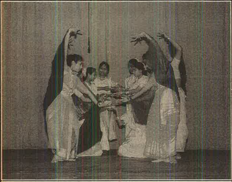
மாவீரர் நாள் நிகழ்ச்சியில் இடம் பெற்ற நடனம்