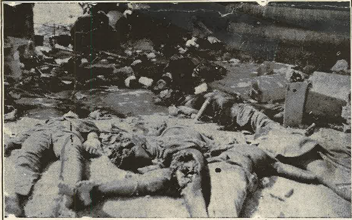
விடுதலைப் புலிகளின் பாய்ச்சலுக்குப் பின்னர் பூநகரி இராணுவத் தளம்

இப்பெரும் தாக்குதலில் மூல்லை, வன்னி, மன்னார், யாழ்ப்பாணம் என்று வட தமிழ் மத்தின் அனைத்து மாவட்டங்க