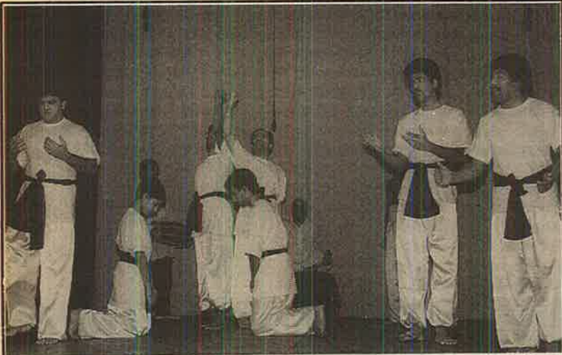
'யாழ்தேவி' நாடகத்தில் இடம் பெற்ற காட்சி ஒன்று