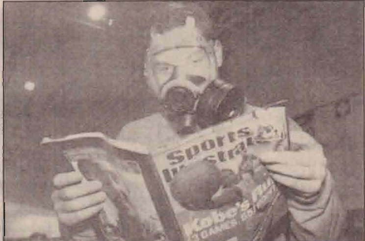
அமெரிக்காவின் ஆபீரகாம் லிங்கன் விமானம் தாங்கிக் கப்பலில் களஞ்சியங்காப்பாளராகக் கடமையாற்றும் படைச்சிப்பாய் ஒருவர் இரசாயனத் தாக்குதலிலிருந்து பாதுகாக்கும் முகமூடியை அணிந்தவாறு ஸ்போட்ஸ் ஸ்டேட்ஸ் பத்திரிகையைப் படித்துக்கொண்டிருக்கிறார்.