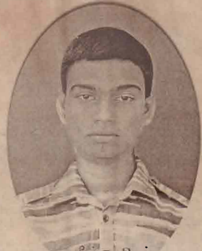
சீவலுவிசர் இரும்பொறை யாழ்/வண்ணார்பண்ணை