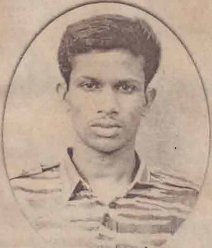
3rd ஓவிசர் மேகன் திருமலை/பன்குளம்