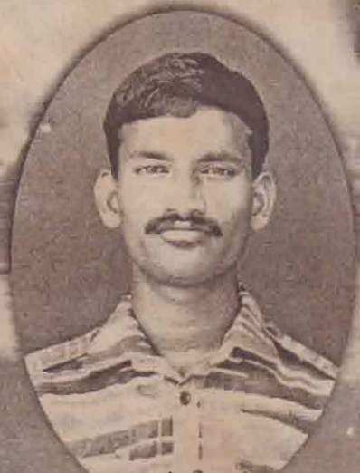
ஏபிள்சீமன் இளம்பரிசி யாழ்/அளவெட்டு