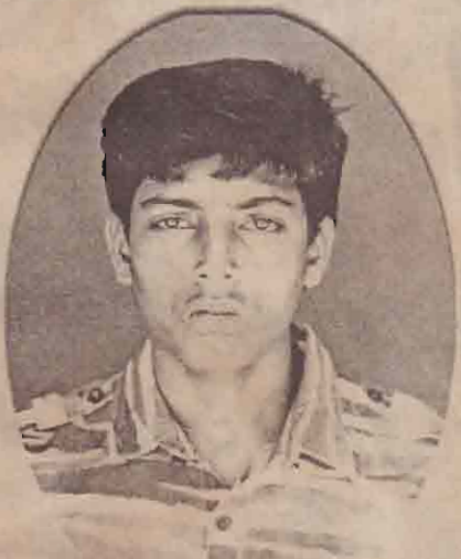
கடேற் சூரயவன் கிளி/திருவையாறு

தீரம் பிசுந்த கொள்கையை வளர்க்க திரை கடல் ஓடித் திரவியம் சேர்த்தோர் ஈரம் தில்லா நெஞ்சத் தவரால் இடை நடுக்கடலில் இல்லாதொழிந்தனர் வீரக் கரங்களும் விம்பிய நெஞ்சம் வங்கக்கடலில் காவிய மாயின சூரப் புலிகளைப் பதினொரு பேரும் சாரமாம் எங்கள் விடியலின் போரில்... தூங்கா திருக்கும் நெஞ்சங்க ளிங்கே தொடரும் உம்பணிகள் சுவடுகள் தொடர்.