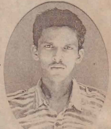
2nd ஊஞ்சினியர் குணிகைமறன்/குணேந்திரன் யாழ்/மறர்சன் கூடல்