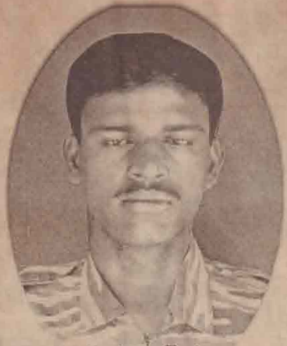
2nd ஓவிசர் கடர்ணன் முல்லை/கள்ளப்பாடு