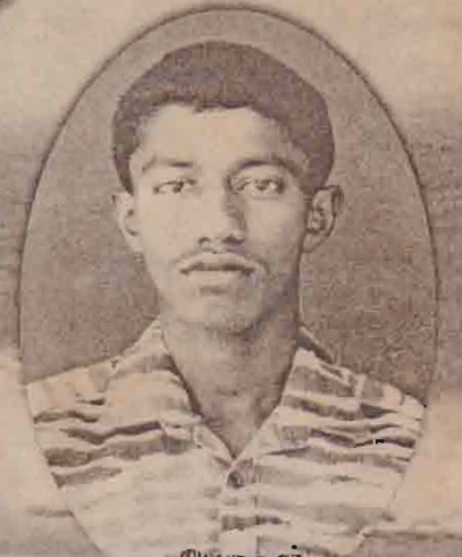
போசன் நவநீசன்/சிடுவ யாழ்/கொக்கவில்