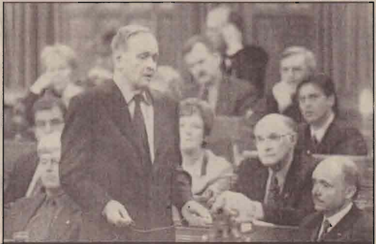
கனடாவின் அரசு பொது மண்டபத்தில் ஈராக் யுத்தம் குறித்து உறுப்பினர்கள் கேட்கும் கேள்விகளுக்கு பதிலளிக்கும் கனேடியப் பிரதமர்.

பிரான்ஸ், கிரேக்கம் ஆகியவற்றின் ஈராக்கிற்கான தூதுவர்களும் அங்கிருந்து வெளியேறியுள்ளனர். தொடர்ந்து ஒரு சில வெளிநாட்டு ராஜதந்திரிகளே ஈராக் கில் தங்கியுள்ளனர்.