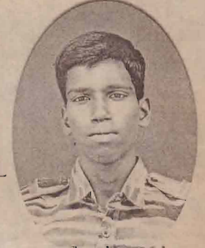
3rd ஊஞ்சினியர் அழகுன் கிளி/மட்டுவில்நாடு