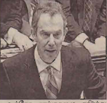
உத்தேச தாக்குதலை எதிர்த்து பிரிட்டன் பாராளுமன்றத்தில் இப் பிரேரணை நேற்று முன்தினம் சமர்ப்பிக்கப்பட்டது. எனினும் எதிர்பார்ப்புகளுக்கு மாறான சமய

அமெரிக்காவுடன் இணைந்து பிரிட்டன் மேற்கொள்ளவுள்ள ஈராக் மீதான தாக்குதலுக்கு பிரிட்டன் பாராளுமன்றம் அங்கீகாரம் வழங்கியுள்ளது. இதுதொடர்பாக கொண்டுவரப்பட்ட பிரேரணையின் மீதான வாக்கெடுப்பில் தாக்குதலுக்கு ஆதரவாக அதிகப்படியான பாராளுமன்ற உறுப்பினர்கள் வாக்களித்தனர்.