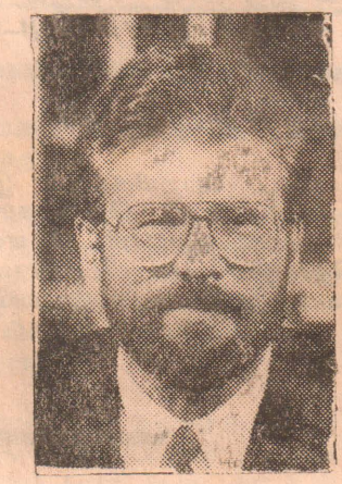
சின்பெயின் தலைவர் ஜெரி அடம்ஸ்

மிகப்பழைய வரலாற்றினை இங்கு புரட்டிப்பார்க்காவிட்டாலும் 1800 ஆண்டளவில் அயர்லாந்து தீவை தன்னோடு பிரித்தானியா இணைத்ததின் விளைவுகளை இன்றையநிலைமைகள் ஆகின்றன என்பதை சொல்ல வேண்டும். இவ்வடிமைத்தனத்திற்கு எதிராக ஐரிசு மக்கள் பலகாலமாகவே நடாத்திய போராட்டங்களின் விளைவும் 1916-21ம் ஆண்டுகளில் ஆங்கில - ஐரிசு போர் நடைபெற்றதின் விளைவாக அயர்லாந்து தீவின் தென்பகுதியில் ஐரிசு குடியரசு என இறைமையுள்ள நாடாகியதும் வரலாறு. இங்கு 95 விழுக்காட்டிற்கு மேல் கத்தோலிக்க மக்கள் செறிந்திருந்தனர். ஆனால் இத்தகைய பிரிவினை உடன்பாட்டில் வராத வட அயர்லாந்தினை அங்குள்ள பெரும்பான்மை