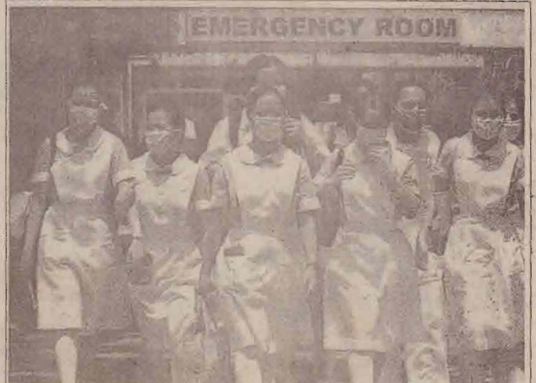
பிலிப்பைன்ஸ் நாட்டில் சார்ல்ஸ் தேய்விக்கப்பட்டுள்ளதாக சந்தேகிக்கப்பட்டவர்களுக்கு சிகிச்சை அளிக்கும் தாதியர்

செய்தி நிறுவனம் நடந்து கொண்ட விதத்தை பி.பி.ஸியின் தலைவர் கடுமையாக விமர்சித்துள்ளார்.