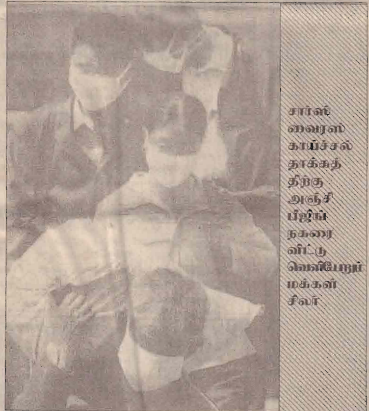
சார்ல்ஸ் வைரஸ் காய்ச்சல் தாக்கத்திற்கு அஞ்சு பீஜிங் நகரை விட்டு வெளியேறும் மக்கள் சிலர்

பின்னர் செய்தியாளர்களிடம் பேசிய அவர், ஒவ்வொரு அனைச்சகத்திற்கும் ஒரு ஒருங்கிணைப்பாளர் இருப்பதாகவும், அனைத்து அமைச்சகங்களும் சரியான இடத்திலிருந்து செயற்படும் என்றும் கூறியுள்ளார்.