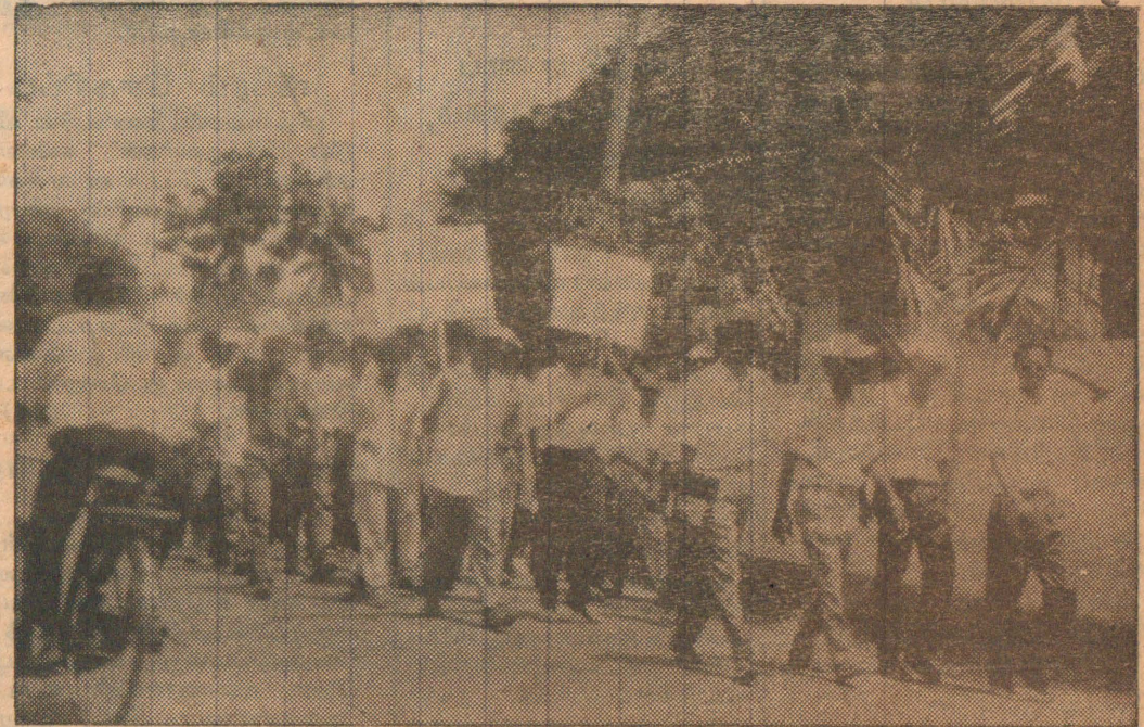
கிளாலியில் கடற்படையின் பிரங்கி தாக்குதலால் மருத்துவபீடமானவன் ஒருவர் கொல்லப்பட்டதைக் கண்டித்து நேற்று நடைபெற்ற ஆர்ப்பாட்டப் பேரணியை படத்தில் காணலாம்.

இதன் பின்னர் இக் குழுவினர் கொழும்பு திரும்புவர் எனவும் தெரியவருகின்றது. இதனை அடுத்து பூநகரி பாதை தொடர்பாக புலிகளுடன் நடைபெறவுள்ள இறுதிக்கட்டப் பேச்சுவார்த்தையில் ஜெனீவாவிலுள்ள அ.ஐ.நா. உயர்ஸ்தானிகராலய தலைமைப் பிரதிநிதிகள் கலந்து கொள்வர் எனவும் தெரியவருகின்றது.