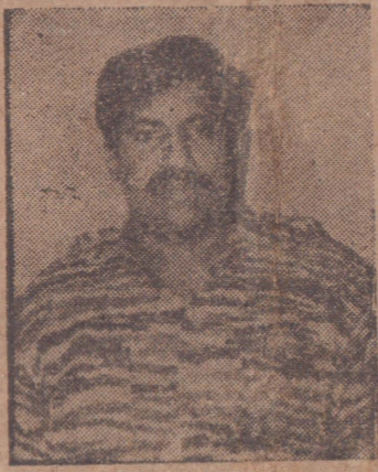
தெரிவித்தார். மேலும் அவர் தனது உரையில் இன்று உலகில் பெரும் மாற்றங்கள் ஏற்பட்டு வருகின்றது. வல்லரசுப் போட்டிகள் குறைவடைந்து வேற்ற வடிவம் எடுத்துள்ளது. இந் (4 ஆம் பக்கம் பார்க்க)