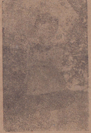
செல்வி மகிழினி பத்மநாதன்