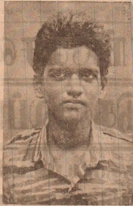
வீரவேங்கை சிவராம் - கலைவேந்தன்