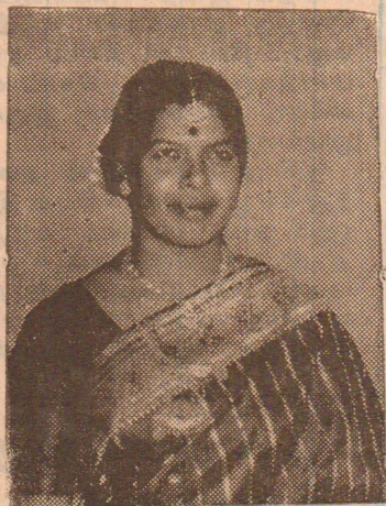
ஆண்டவன் அடியில் மலரிது அடைந்த நாள் 24-01-1991