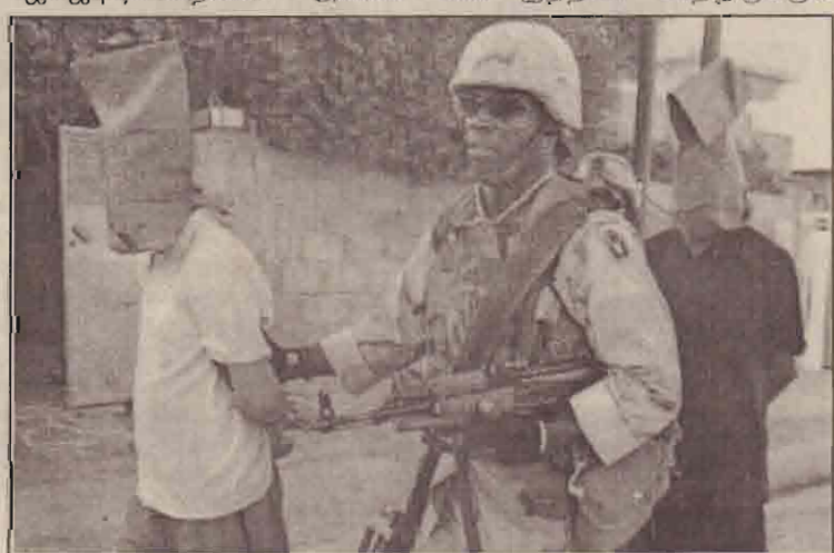
பாக்தாத்துக்கு நூறு கி.மீ தொலைவில் ரமாத் நகரில் தேடுதல் நடவடிக்கையின் போது ரஷ்ய தயாரிப்பு AK 47 ரக துப்பாக்கியுடன் கைது செய்யப்பட்ட நபரை அழைத்துச் செல்லும் அமெரிக்க வீரர்

எல்லை கடந்த பயங்கரவாதம் நிறுத்தப்பட வேண்டும் என்பதே தமது கவலை. இவ்விடயத்தில் சர்வதேச அளவில் நமது நட்பு நாடுகள் இந்தத் தகவலை ஏற்கின்றன என்றும் கூறியுள்ளார். பாகிஸ்தானுடன் சீனாவின் நெருக்கிய உறவுகள் பற்றிக் கேட்டமைக்கு, தாம் ஏற்கனவே ரஷ்யாவில் மேற்கொண்ட அண்மைய பயணத்தின் போது சீன அதிபர் ஜூ ஜின்டாவுடன் இதுபற்றிப் பேசியிருப்பதாகவும் அவர் கூறியுள்ளார்.