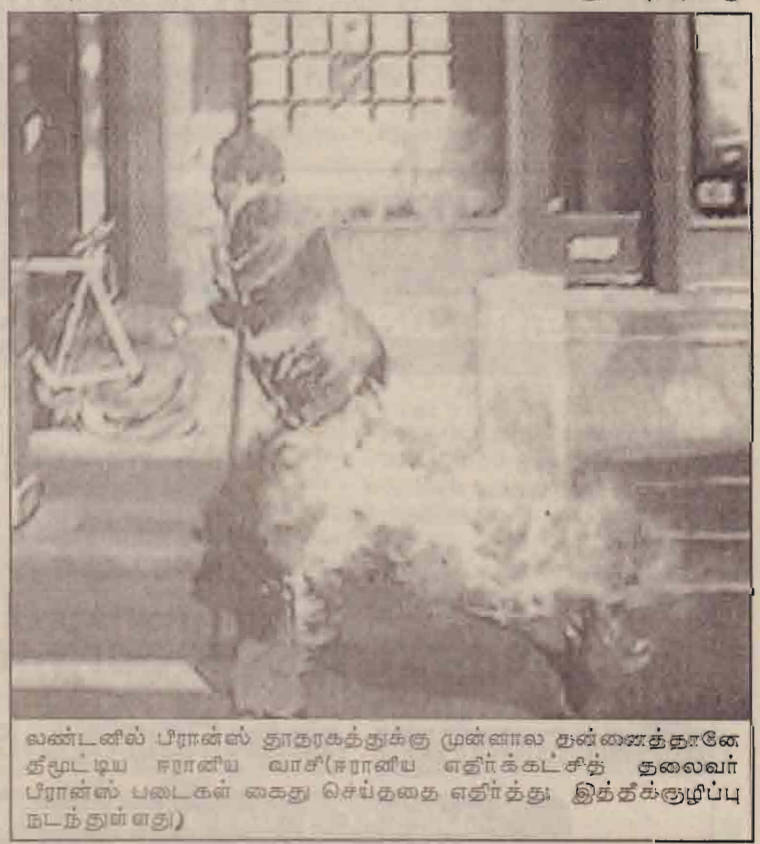
லண்டனில் பிரான்ஸ் தாதரகத்துக்கு முன்னால தன்னைத்தானே தீமூட்டிய ஈரானிய வாசி(ஈரானிய எதிர்க்கட்சித் தலைவர் பிரான்ஸ் படைகள் கைது செய்ததை எதிர்த்து, இத்தீக்குழிப்பு நடந்துள்ளது)