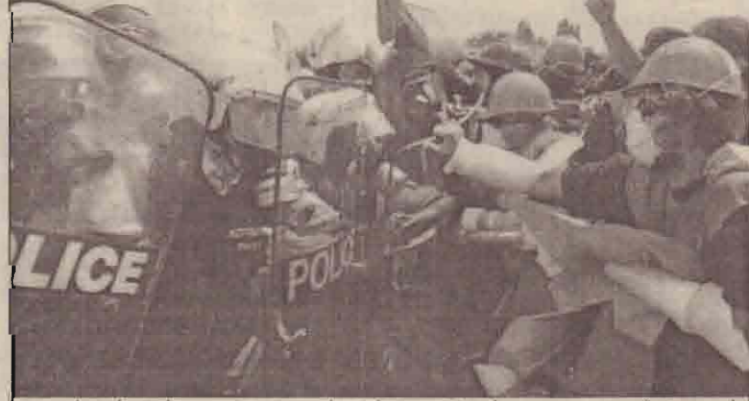
கீரேக்கத்தின் கிராமப்புறத்தில் கீரேக்க அதிருப்தியாளர்களுக்கும் பொலிசாருக்கும் இடையே ஏற்பட்ட மோதல். ஐரோப்பிய யூனியனின் உச்சமாநாடு நடக்கும் விடுதியை முற்றுகையிட கலக்க காரர் முயற்சி.

(பெய்சிங்) சாங்ஸ் வைரஸ் பரவாது இருப்பதற்காக உல்லாசப் பயணிகள் திபெத்தினுள் செல்ல விதிக்கப்பட்டிருந்த தடையை யுலை மாதம் முதலாம் திகதி முதல் நீக்கவுள்ளதாகச் சீனா நேற்று அறிவித்துள்ளது. இரண்டு மாதகாலத்திற்கு மேலாக விதிக்கப்பட்ட தடை நீக்கப்படுவதாக உத்தியோக பூர்வப்பத்திரிகை கூறுகின்றது. சீனாவில் சாங்ஸ் இடோது கட்டுப்பாட்டில் கொண்டு வந்துள்ள எமையினாலும், திபெத்தில் இது வரை வெரும் சாங்ஸினால் பீடிக்கப்படாமல் உறுதி செய்யப்படாமையினாலும் உல்லாசப் பயணிகள் தடையை நீக்குவதாகக் கூறப்படுகின்றது.