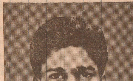
வீரத் தாயவள் மடியில்

“செந்தமிழ் மண்ணிலே வரலாறு படைத்திடும் மாவீரர் வரிசையில்.....”