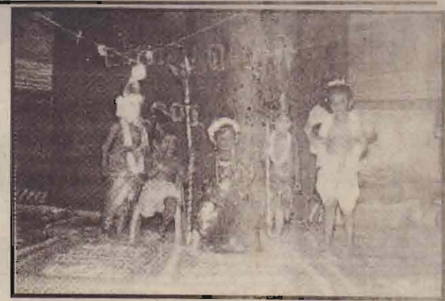
1993 ஆம் ஆண்டு 35 சிறார்கள் பயன்பெற்ற இப்பூங்காவில் சிறுவர்கள் தொகை வருடாவருடம் அதிகரித்து இவ்வருடம் இப்பூங்காவில் 130 சிறார்கள் பயன்பெற்று வருகின்றனர்.

இரண்டு ஏக்கர் நிலப்பரப்பினை உடைய இப்பூங்காக்கானியில் தென்னை, மா, பலா, தேசி, முருங்கை, புளி போன்ற பயன்தரு மரங்கள் இருக்கின்றன. இரண்டு வகுப்பறைகளும், அலுவலகம், சமையலறை, மலச்சலகடம், கிணறு என்பனவும் இங்கு உள்ளன.