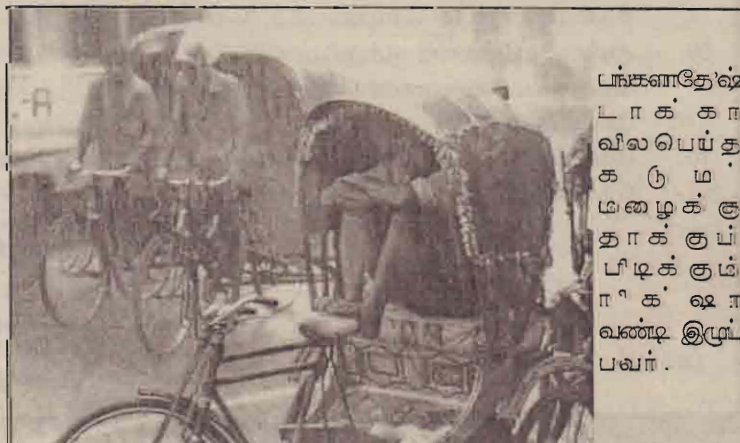
புக்களாதேஷ்டாக் காவிலபெய்தகும் மழைக்குதாக்குப் பீடிகும் ஈக்ஷா வண்டி இயப்பவர்.

தென் கொரிய சனாதிபதி ஜப்பானில் 04 நாட்கள் விஜயம் மொன்றை மேற்கொண்டிருந்தார்.