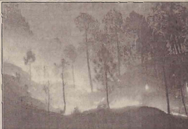
இந்தியாவில் உத்தராஞ்சல் மாநிலத்தில் த்வாராட் கிராமத்திற்கண்மையில் ஏற்பட்ட காட்டுத்தீ (4 சீறாக்கள் உட்பட 600 ஏக்கர்) இடில் மாண்டனர்