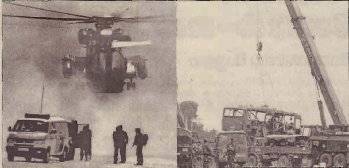
குண்டு வெடிப்பு நடந்த இடத்தை நோக்கிச் செல்லும் சர்வதேச உதவிப் படையினரின் உலங்குவானாந்தியையும் தற்கொலைத் தாக்குதலுக்குள்ளான ஜேர்மன் சமாதான படையினரை ஏற்றிச் சென்ற பேருந்துவண்டி பாரம் தூக்கியால் தூக்கப்படுவதையும் படங்களில் காண்க.

முன்னர் பர்மா என்று அழைக்கப்பட்ட மியன்மாரின் கனடா தூதுவரை கனடாவின் வெளிநாட்டு அமைச்சர் பில்கிரகாட் சந்தித்து தமது நாட்டின் அதிருப்தியைத் தெரிவித்துக் கொண்டார்.