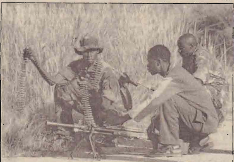
புரையல் சிஸ்சியாள் கருடன் ஆண் மையில் புத்தாக ஏற்பட்ட மோதலின் போது கொங்கோ குடியரசில் பணியா நகரில் நிலை எடுத்துள்ள போர்வீரர்கள்.

அப்போது அங்கிருந்து காணாமல் போனதாகக் கருதப்படும் அணுவாயுதப் பொருட்கள் குறித்து அவர்கள் விசாரணை மேற்கொண்டுள்ளனர்.