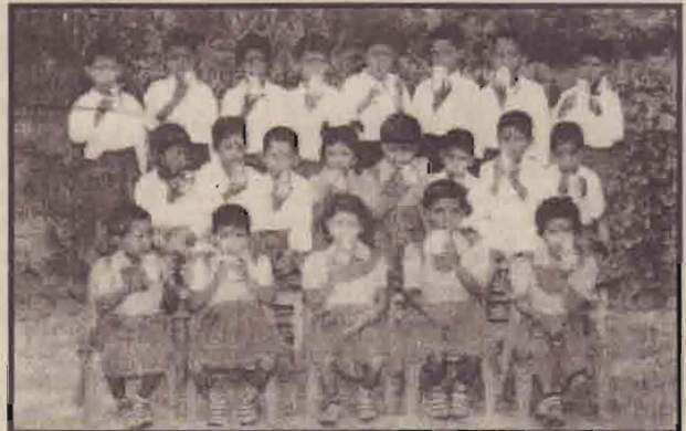
பாதிப்புற்ற குழந்தைகளுக்காகக் கடந்த பத்து ஆண்டு களாக அளப்பரிய பணியை ஆற்றி வருகின்றது.

விசுவமடு இளங்கோபுரம் சோழர் பராமரிப்புப் பூங்கா