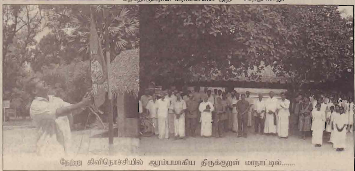
நேற்று கிளிநொச்சியில் ஆரம்பமாகிய திருக்குறள் மாநாட்டில்.....