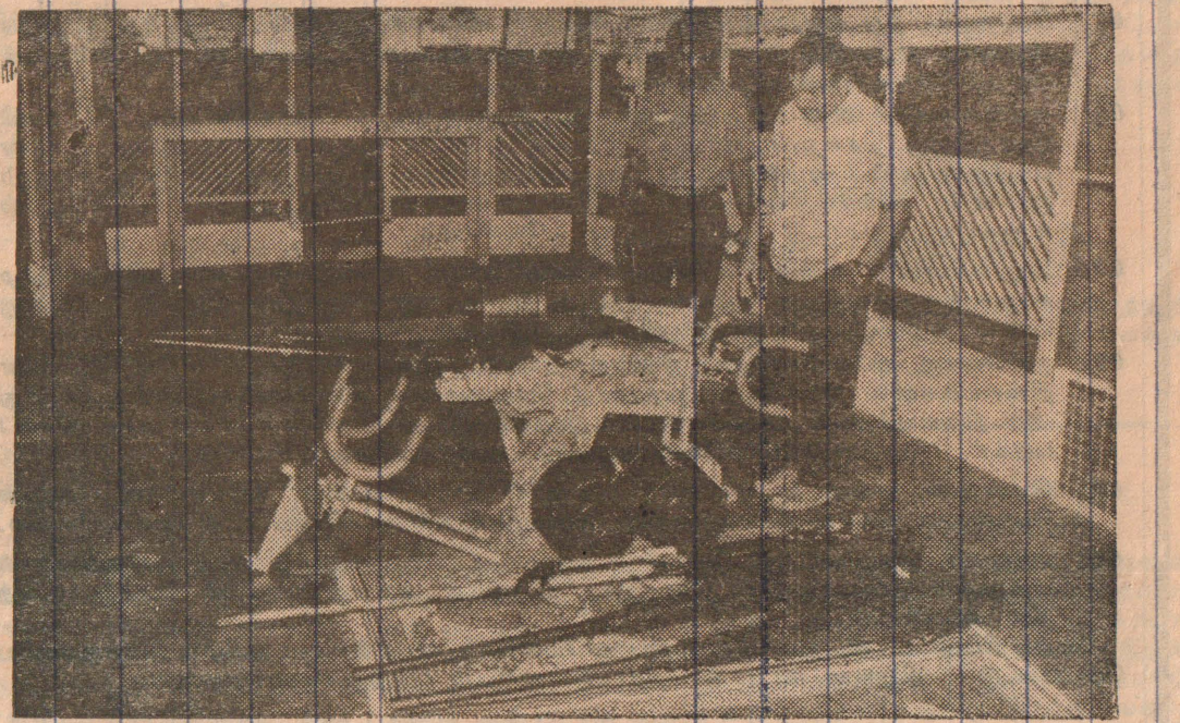
தலைவர் பிரபாகரன், நேற்று கடற்புலிகளால் கைப்பற்றப்பட்ட இரு 20 எம்.எம். பிரங்கிகள், இரு 50 கலிபர் துப்பாக்கி ஆகியவற்றை பார்வையிடுகிறார்.

நேற்று பருத்தித்துறைக் கடலில் கடற்புலிகளால் கைப்பற்றப்பட்ட 20 மி. மீ. இலகு பிரங்கி (அஸ்ரா ஒளிகை 41 ஏ இலகு கலிபர் பிரங்கி) குறித்த சில தகவல்கள்: கலிபர் : 20 மி. மீ. குழலின் நீளம் : 70 கலிபர்கள் குண்டுகள் ஆரம்பம் வேகம் : செக்கனுக்கு 825-835 மீற்றர்கள் தூர வீச்சு கிடைபாக - 4.39 கிலோமீற்றர் உயர்த்தி - 3 கிலோமீற்றர் கடும் வீதம் - நிமிடத்துக்கு 800 குண்டுகள் வெடிப் பொருளின் நிறை - 244 - 264 கிராம் (சுமார் 1 1/4 கிலோ) [4ஆம் பக்கம் பார்க்க]