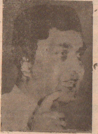
முன்னாள் அமைச்சர் காமினி திசாநாயக்கா தெரிவு செய்யப்பட்டுள்ளார்.

(கொழும்பு) சிறிலங்கா பாராளுமன்றத்தின் எதிர்க்கட்சித் தலைவராக