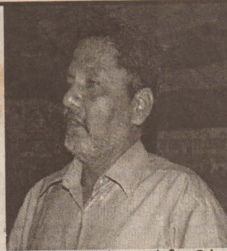
மேற்கூலக நாடுகள் முயற்சி எடுத்து வருகின்றன.

சூழல் பற்றி கவனப்பீடு என்பது எங்கள் எல்லோரிடமும் உள்ளது. எத்தனையோ முயற்சிகளுக்கு ஊடாக சூழலைப் பாதுகாப்பதற்கு