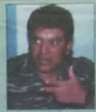
தமிழ்த் தேசிய தினத்தைப் பேரறிவுடன் உணர்வதில் அளிக்க

மூத்த தமிழர்கள் தனித்தனியான தின அடையாளத்தைக் கொண்டவர்கள், ஒரு தேசிய தினக் கட்டமைப்போடு அந்த தினத்தையே சீர்குலைப்போடு வாரமுதிழைகள் தாமாகக் கருத்து வளமாற்றிவிடலாம். தாமதமாகக் கொடுத்திருக்கும் மூத்தவர்கள் விருதுகளுக்கும் ஒன்றுதான் தாமத சேர்த்த மனத்தில் தியானமாக நின்றால் வாய்மையே வெல்லும்.