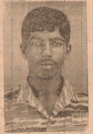
வத்துடனான பல மோதல்களில் திறமையாகச் செயற்பட்ட (4 ஆம் பக்கம் பார்க்க)

இவர் 1988 ஆம் ஆண்டு காலப்பகுதியில் இயக்கத்தில் இணைந்தவர் பயிற்சிகளை முடித்தபின் இந்திய இராணுவ