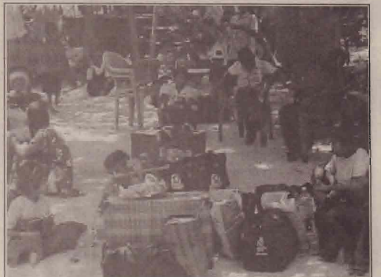
வவுனியாவிலிருந்து கிளிநொச்சிக்கு மீள்குடியமர வருகை தந்துள்ளோரில் ஒரு பகுதியினர்.

மலையாளபுரம், ஜெயந்திநகர், அம்பாளநகர், திருவையாறு போன்ற இடங்களில் இருந்து இராணுவ நடவடிக்கை மூலம் இடம் பெயர்ந்து மேற்படி நலன்புரி நிலையங்களில் தங்கியிருந்தமை குறிப்பிடத்தக்கது. (பா)