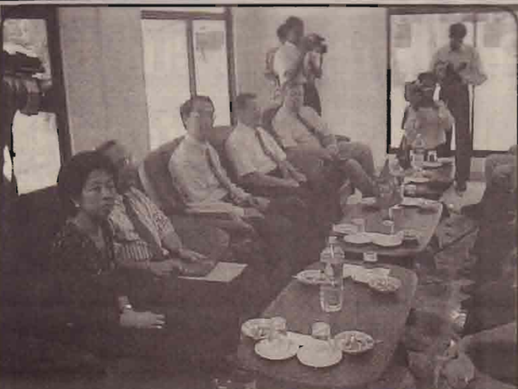
புலிகளுடனான சந்திப்பில் கலந்து கொண்ட ஆசிய அபிவிருத்தி வங்கிப் பிரதிநிதிகள்