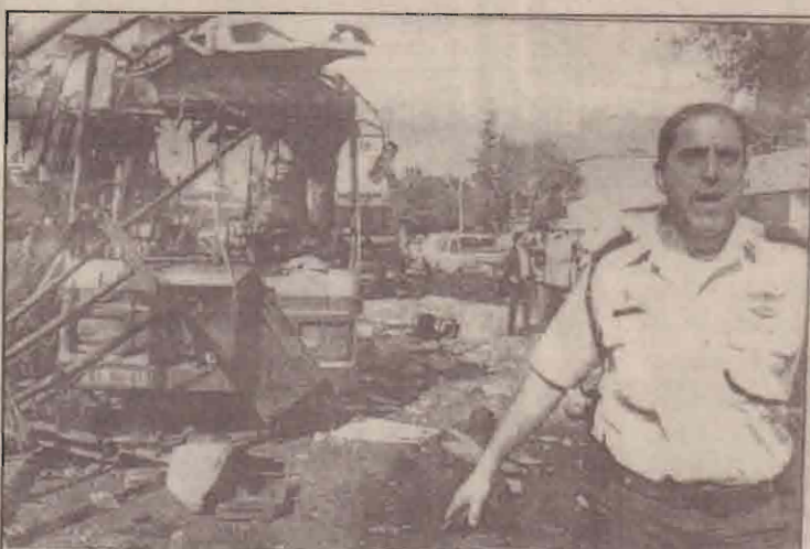
பலஸ்தீனரின் தற்கொலைக் குண்டுதாரியின் தாக்குதலில் சேதமடைந்துள்ள இஸ்ரேலியப் பேருந்து

இதனிடையே ஓசாமா பின்லேடன் உயிருடன்தான் இருக்கின்றார் எனவும் அவர் தீவிர இஸ்லாமிய வாதிகளின் பாதுகாப்புடன் பாகிஸ்தானில் வாழ்கிறார் எனவும் கட்டாரிலிருந்து ஒளிபரப்பப்படும் அல்யக்ரா தொலைக்காட்சி தெரிவிக்கின்றது. ஓசாமாவினால் எழுதப்பட்ட கடிதங்கள் பாகிஸ்தானில் கைது செய்யப்பட்ட காலித் ஷேக் முகமத்திடம் இருந்ததாக இந்த தொலைக்காட்சி கூறுகின்றது.