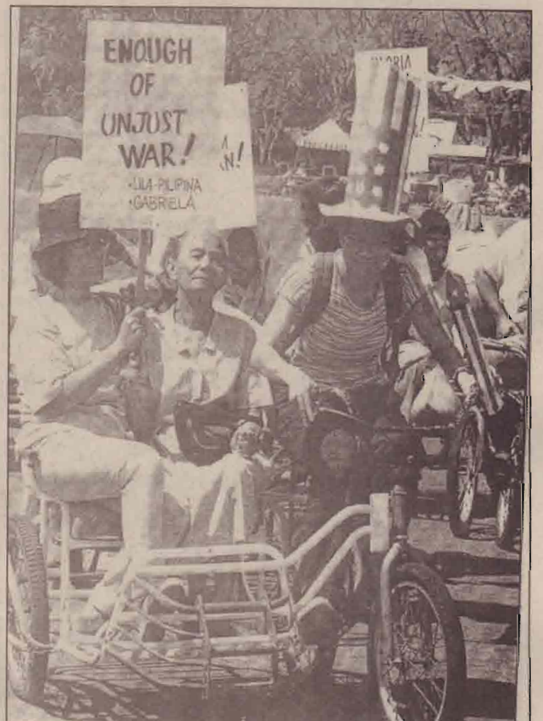
ஈராக் மீதான தாக்குதலிற்கு எதிர்ப்புத் தெரிவிக்கும் பிலிப்பைன்ஸ் மக்கள்