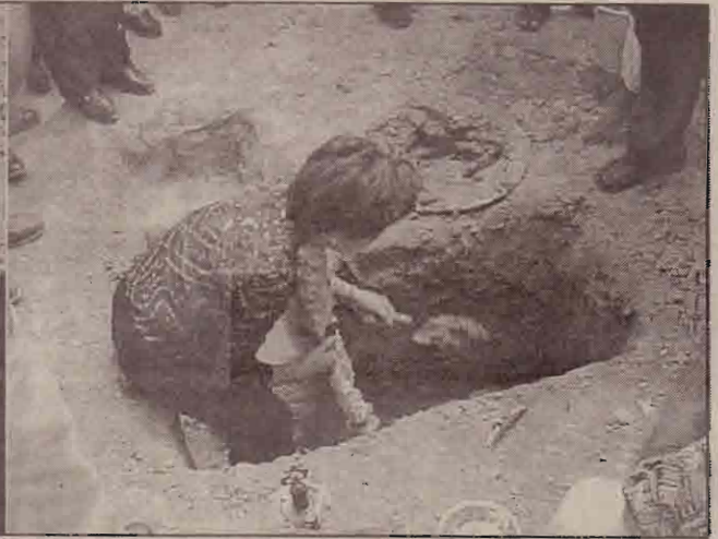
கிளிநொச்சியில் புதிதாக அமைக்கப்படவுள்ள மருத்துவமனைக்கான அடிக்கல்நாட்டு விழாவில் கலந்து கொண்ட ஆசிய அபிவிருத்தி வங்கிக்குழுவினரையும், ஆசிய அபிவிருத்தி வங்கித் தலைவர் மற்றும் பிரதிநிதிகள் அடிக்கல் நாட்டுவதையும் மேலுள்ள படங்களில் காணலாம்.