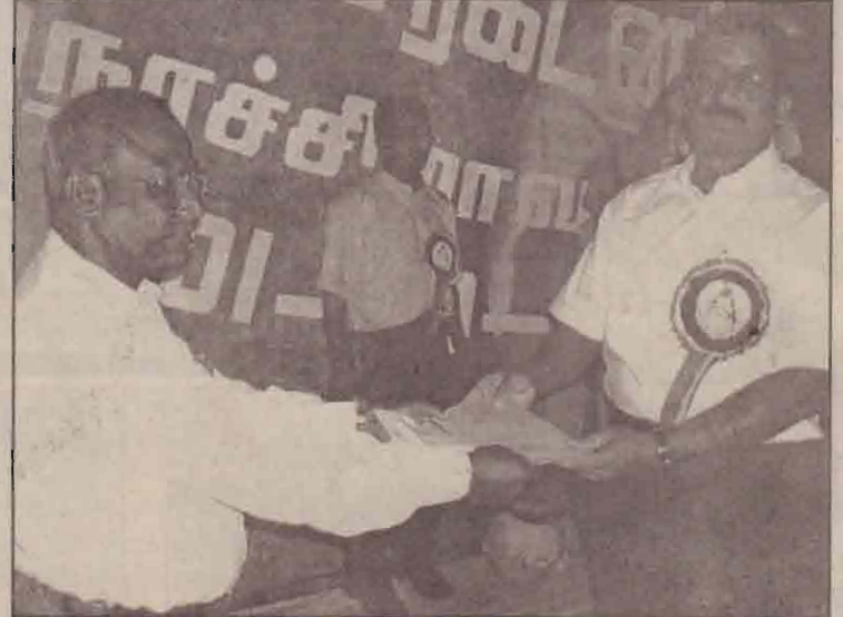
தமிழ்முத்தேசியத்தலைவருக்கான எழுச்சிப்பிரகடன பிரதிகைய அரங்கம் நிறுவனங்களின் இணையதலைவர்களை சேர்ந்தவர்கள் அவர்களிடம் கையளித்தார். (சோ)

எழுச்சிக்கட்சர் ஏற்றலோடு பிரகடன நிகழ்வின் அரங்க நிகழ்வுகள் ஆரம்பமாகின. எழுச்சிப்பாடலுடன் அமைந்த கோசங்கள் எழுப்பப்பட்டதைத் தொடர்ந்து ஆசியுரைகளை (IV ஆம் பக்கம் பார்க்க)