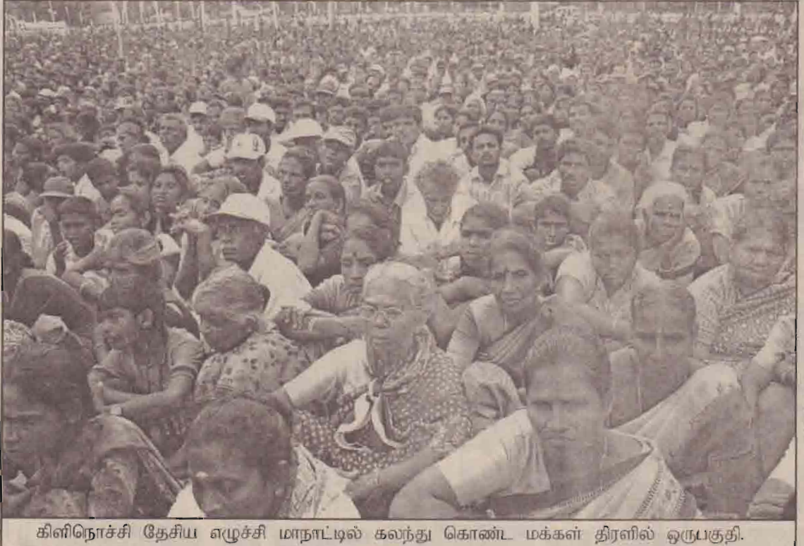
கிளிநொச்சி தேசிய எழுச்சி மாநாட்டில் கலந்து கொண்ட மக்கள் திரளில் ஒருபகுதி.