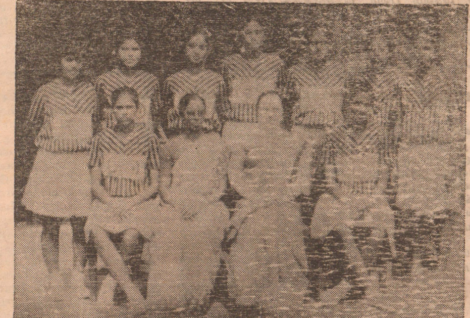
19 வயதிற்குட்பட்ட உடுவில் மகளிர் கல்லூரி அணி

இந்த வகையில் யாழ் பல்கலைக்கழகவிளையாட்டு அவையினால் வருடா வருடம் நடாத்தப்பட்டுவரும் ஆண், பெண் இருபாலாருக்குமான கூடைப் பந்தாட்ட சுற்றுப் போட்டி இந்த ஆண்டும் மிகச் சிறப்பாக யாழ் பல்கலைக்கழக கூடைப்பந்தாட்ட விளையாட்டுத் திடலில்கடந்த 20-6-94 - 08-07-94 வரையான காலப் பகுதியில் நடந்து முடிந்தது. இச்சுற்றுப் போட்டி