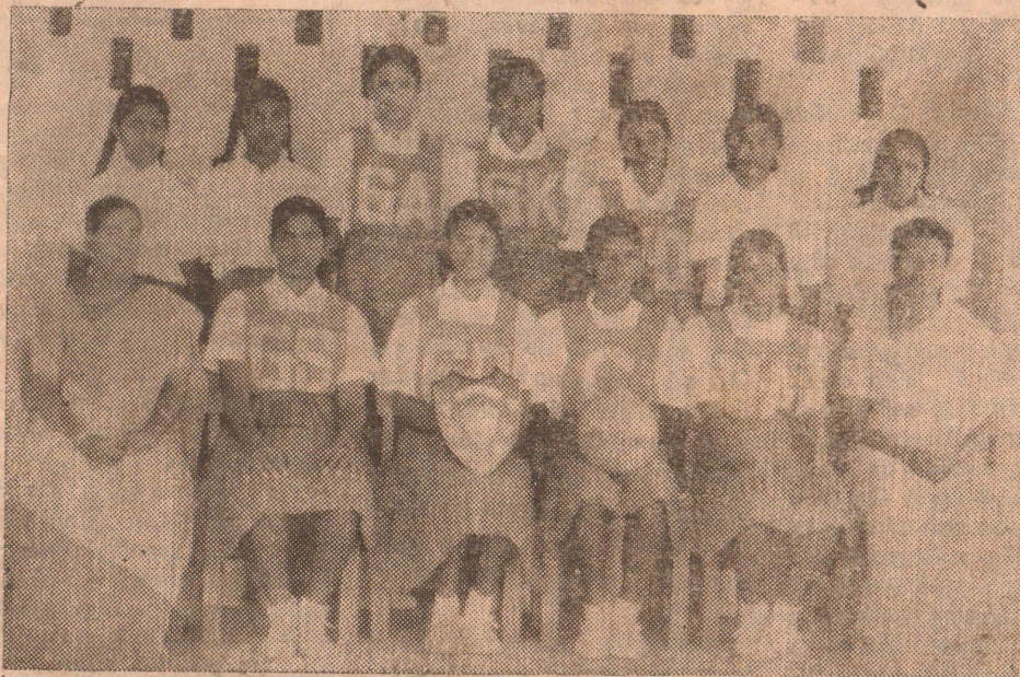
17 வயதிற்குக் கீழ்ப்பட்ட மெதடிஸ் அணி

மெதடிஸ் அணி இரண்டாவது முறையாக சம்பியன் பட்டத்தைத் தக்கவைத்துக்கொண்ட அதேவேளை முற்றிலும் புதிய ஒரு அணியாக யாருமே எதிர்பார்க்காத ஒரு அணிபாக இறுதிப் போட்டியில் பங்குபற்