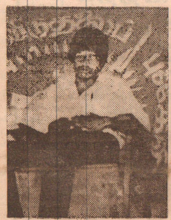
அஞ்சலி செலுத்தினார். தலைப்பின் ஐந்தாம் ஆண்டு

இக் கோஷ்டியினர் கொழும்பு, கோட்டை, வெள்ளவத்தை, நாரேன்பிட்டி யுய பகுதிகளில் வாழும் தமிழர் வீடுகளுக்குள் புகுந்து அவர் களைப் புலிகள் எனக் கூறி அவர்களிடமிருந்து பொருட் களை அபகரித்துக் கொண்டு அதற்கு ரதேசுகளும் வழங்கி யுள்ளனர். இதன் போது இவர்கள் தமிழ் மக்களிடம் நீங்கள் உங்களது ஆளடையாளங் (4 ஆம் பக்கம் பார்க்க)