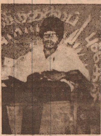
அஞ்சலி செலுத்தினர். திலீபனின் ஐந்தாம் ஆண்டு

தியாக மரணமடைந்த தியாக திலீபன் லெப் கேணல் திலீபனுக்கு தமிழ் மக்கள் இரண்டாவது நாளாக நேற்று