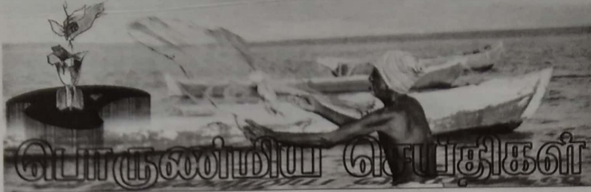
சென்ற இடது தொடர்ச்சி