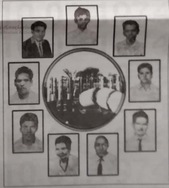
கொள்கை மாற்றம் இன்னும் முழுமையாக இருக்கின்றது.

கருத்து மாற்றம் ஏற்பட்ட சமூகத்தினருக்கு அவர்களின் வேண்டுகோள்களும் நோக்கங்கள்க்கும் ஏற்ப செயற்பாடுகள் சீர்குலைப்புகளாகும். இது அரசியல்வாதிகளின் ஆட்சி நடைபெறுகின்றது என்பதற்கும் சீர்குலைப்புகளாகும்.