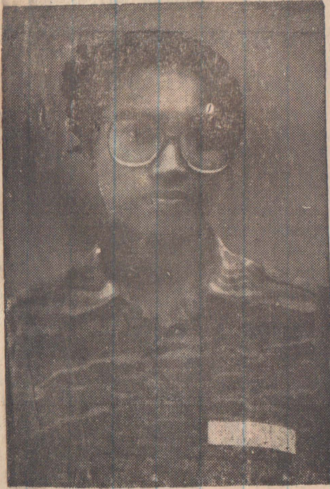
வீர ஜனனம் 30 - 03 - 1964