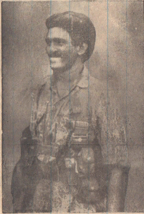
வீர ஜனனம் 06 - 09 - 1962