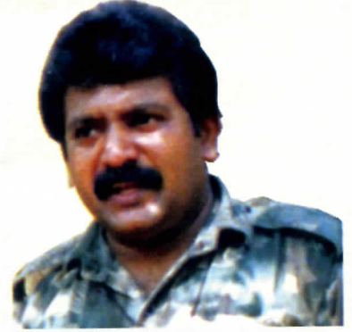
தமிழீழத் தேசியத்தலைவர் மேதகு வே. பிரபாகரன் அவர்கள்

எந்தப் பலத்திலும் ஒரு பலவீனம் இருக்கும். அதனைக் கண்டுபிடித்து, அதற்கேற்ற விதத்தில் துணிகரமான நடவடிக்கைகளை மேற்கொள்வதில்தான் எங்களுடைய வெற்றியே தங்கியிருக்கிறது.