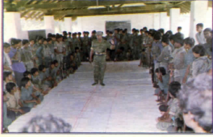
இலக்கற்ற ரணகோசாவும் இலக்குக்கான போரெழுச்சியும்