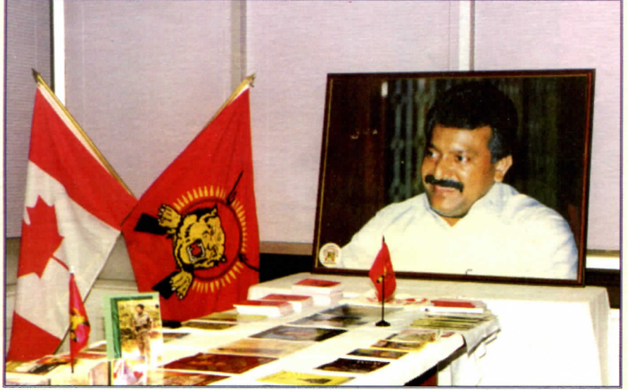
கனடாவில் சர்வதேச மாநாடு பக்கம்- 12