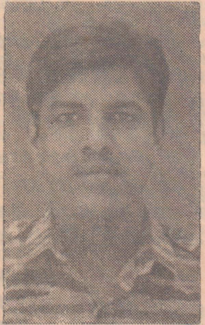
லெப். கேனல் கிறேசி

கோவன் என்று கேட்டது சிந்திநேர மெனனத்துக்குப் பின் சுகி சொல்வதொடங்கினார். '90ஆம் ஆண்டு அஞ்சாம் மாசம் இருபத்தைந்தாம் திதி எங்கே சலியாணம் நடந்தது. சலியாணம் முடிஞ் சவுடன ஒரு மாசம் எங்களுக்கு லீவு கிடைச்சது? அது கிடயில் சண்டை துடங்கியிட்டு