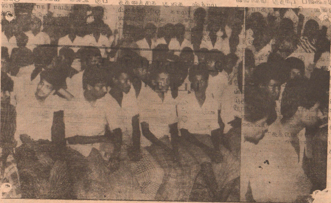
விடுதலைப்புலிகளால் தடுத்து வைக்கப்பட்டு நேற்று சாவகச்சேரியில் விடுதலை செய்யப்பட்டவர்களில் ஒரு பகுதியினர்.

(யாழ்ப்பாணம்) பாதசாரிகளுக்கும் வாகனங்களுக்கும் இடைஞ்சல் விளைவிக்கின்றன என்ற காரணத்துக்காக பெரிய கடைப் பகுதியில் இருந்த நடை பாதைக் கடைகள் ஏற்கனவே அப்புறப்படுத்தப்பட்டன நடைபாதை வியாபாரிகளுக்கு உதவி செய்யும் நோக்கத்தோடு கஸ்தூரியார் வீதி வண்ணான்குளத்துக்கருகில் இவர்களுக்கு இடங்கள் ஒதுக்கி வழங்கப்பட்டன வழங்கப்பட்ட இந்த இடத்தை ரூபாய் 1000 வாங்கிக் கொண்டு சிலர் விற்று வருகிறார்கள்