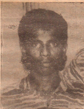
கரும்புலி கப்டன் சிதம்பரம்