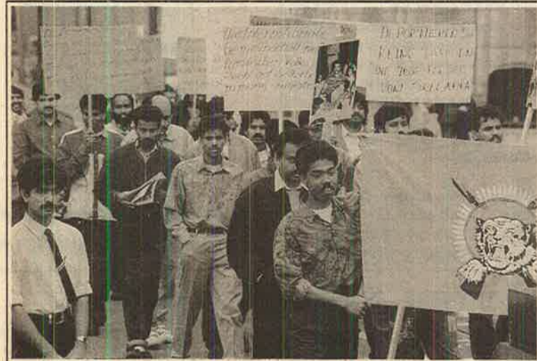
நடக்கப்பட்டது. உலகத் தமிழர் இயக்க ஊர்தியில் ஈழத் தமிழரின் இன்றைய நிலையை