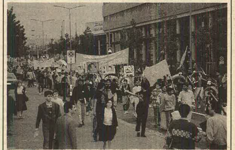
சுவிஸில் நடைபெற்ற மேதின ஊர்வலம்

இந்நிலையில், சுமார் இரண்டாயிரம் சதுர கிலோமீற்றர் பரப்பில் சிறீலங்கா நடத்த முற்படும் ஆயுதப் பலப்பரிட்சை, வீணான உயிர் உடைமை அழிவுகளைத் தோற்றுவிக்க வாய்ப்புகள் உண்டு. 1981 ஆம் ஆண்டு குடிசன மதிப்பீட்டின்படி யாழ் மாவட்டம் 712 ஆள் / சதுர கிலோமீற்றர் எனும் அடர்த்தியான குடிசன செறிவை கொண்டிருந்தது. தற்போது சிறீலங்கா