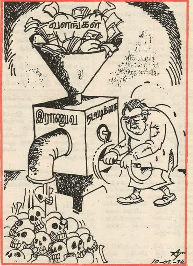
தொடுவாயில் நடந்த தாக்குதல் வரை நீடித்தது.

ஆனால் 1991 மாரியில் விடுதலைப் புலிகளின் தலைவர் பிரபாகரன் அறிமுகப்படுத்திய போர் யுக்தியானது 1992 ஆம் ஆண்டின் இறுதியில் சிறீலங்கா இராணுவத்திற்கு பெரும் தோல்வியையும் சலிப்பையும் ஊட்டுவதாக இருந்தது. 1991 கிறிஸ்துமஸ்ஸிற்கு முந்திய நள்ளிரவு மணலாற்றில் கொக்குத்தொடுவாயில் புலிகள் தொடங்கிய வெற்றிகரமான அதிரடித் தாக்குதல் 1992 ஆம் ஆண்டு அதே கிறிஸ்துமஸ்ஸிற்கு முந்திய இரவு கொக்குத்