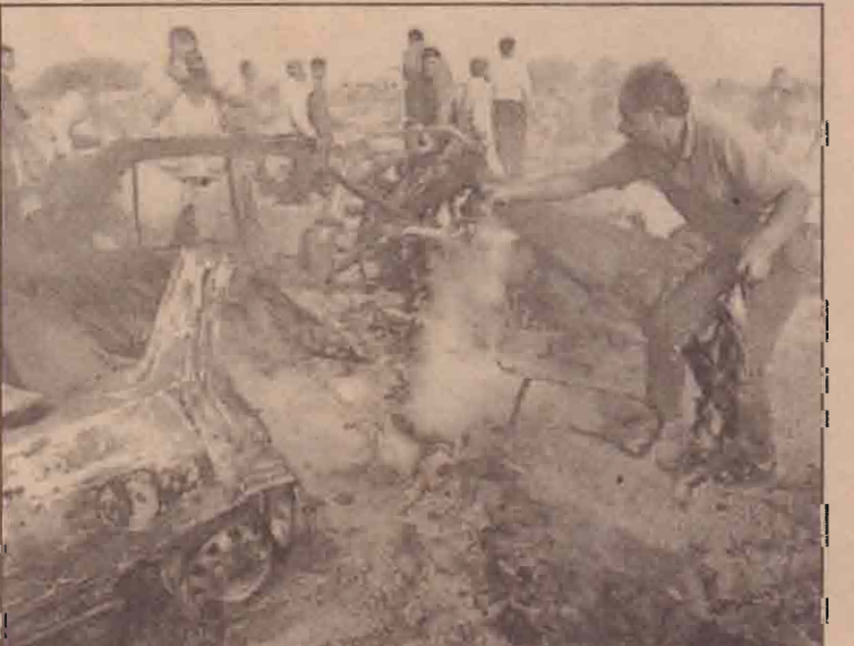
காசாவில் இஸ்ரேலிய உலங்குவானூர்தியின் தாக்குதலுக்குள்ளாகி அழிந்த பலஸ்தீனின் காசில் இரும்பு இறங்குவதற்கு உடற்பாக்களும் உடுப்புக்களும் மீட்கப்படுகிறது. இச்சம்பவத்தில் கமால் இயக் கத்தைச் சேர்ந்த இருவரும் ஒரு பலஸ்தீனப் பொது மகனும் கொல்லப்பட்டிருந்தனர்.