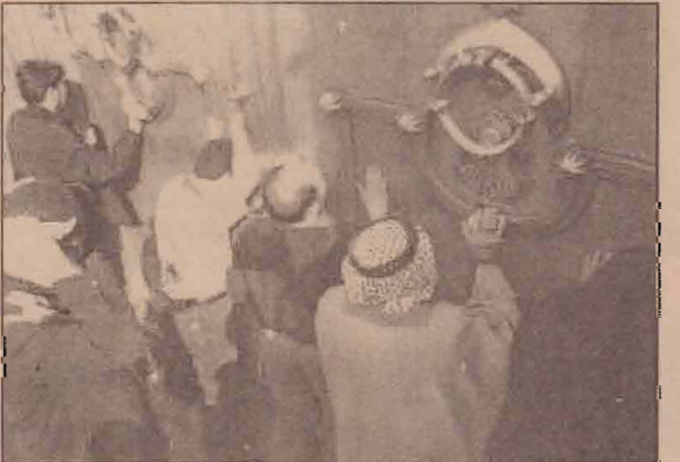
கடந்த செவ்வாய்க்கிழமை தற்கொலைக் குண்டுத் தாக்குதல் இடம்பெற்ற சராக்கில் கசீமீயா மாவட்டப் பள்ளிவாசலின் வாசல்பகுதியில் நேற்று தொழுகையின்படிருக்கும் மக்கள்.

இந்தத்தடை தொடர்ந்து நீடித்தால் உலக வர்த்தகத்துக்கு 50 ஆயிரம் கோடி டொலர்கள் நட்டம் ஏற்படும் என்று ஐ.நா. உணவு மற்றும் வேளாண்மை அமைப்பு எச்சரித்துள்ளது.