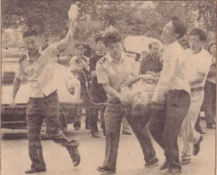
சீனாவின் தென்மேற்கு மாகாணமான யுனான் இல் தீருமணப் பந்தியில் கலந்துகொண்ட உணவை உண்டதால் 76 பேர் மயக்கமுற்று வைத்தியசாலைக்குக் கொண்டு செல்லப்பட்டனர். இவர்களில் ஒருவரைத் தூக்கிச் செல்லும் காட்சியே இது.

எனினும் சரான் களவான முறையில் அணுவாயுத உற்பத்தியில் ஈடுபடுவதாக அமெரிக்கா தொடர்ந்து குற்றம் சாட்டி வருகிறது. அத்துடன் ஐ.நா.சபை அந்த நாட்டின் மீது கட்டுப்பாடுகளை கொண்டு வரவேண்டும் என்றும் கேட்டுள்ளது.