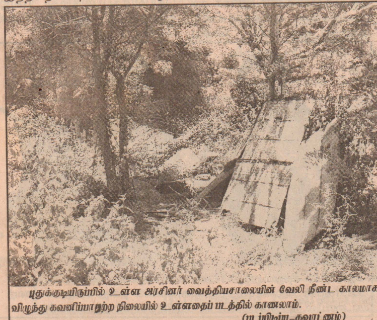
புதுக்குடியின்பில் உள்ள அரசினர் வைத்தியசாலையின் வேலி நீண்ட காலமாக விழுந்து கவனிப்பாற்றாத நிலையில் உள்ளதைப் படத்தில் காணலாம். (யாழ்ப்பாணம்-தவராணம்)

சமாச்சத்தின் பேருந்து, தமிழீழ போக்குவரத்துக்கழக பேருந்து போன்றவற்றின் உதவியினால் துபால் சேவை துரிதமாக நடைபெறுகின்றது. அத்துடன் உடைந்து சிதைந்திருந்த துபால் சேகரிப்புப் பெட்டிகள் புனரமைக்கப்பட்டு அதனுள் துபால் சேகரிக்கப்பட்டு வருவதும் குறிப்பிடத்தக்கது. (20)