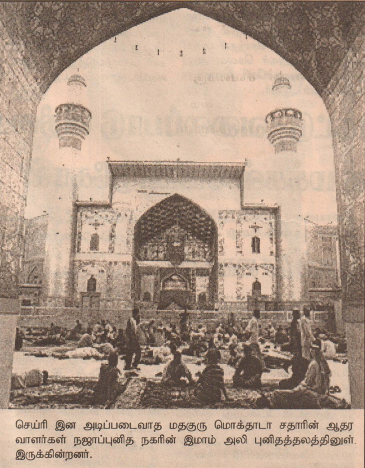
செயரி இன அடிப்படையாக மதகுரு மொக்தாடா சதாரின் ஆதரவாளர்கள் நஜாப்நிபுனித நகரின் இமாம் அலி புனிதத்தலத்தினுள் இருக்கின்றனர்.

வதும் தனிமைப் படுத்தப்பட்டுள்ளது. கோழி, வாத்து போன்ற பறவைகளை அங்கிருந்து வெளியே கொண்டு செல்வது தடை செய்யப்பட்டுள்ளது. பறவைக்காய்ச்சல் பரவியுள்ளதால் மலேசியாவின் கோழிப்பண்ணைத் தொழிலுக்கு பெருத்த அடி ஏற்பட்டுள்ளது அண்டை நாடான சிங்கப்பூர், தினசரி 1.25 லட்சம் கோழி, 20 ஆயிரம் வாத்துக்களை மலேசியாவிலிருந்து இறக்குமதி செய்துவந்தது பறவைக் காய்ச்சல் காரணமாக இறக்குமதிக்குத் தடைவிதித்துள்ளது சிங்கப்பூர்.