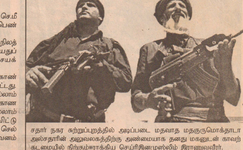
சதார நகர சுற்றுப்புறத்தில் அடிப்படை மதவாத மதகுருமொக்தாடா அல்சதாரின் அலுவலகத்திற்கு அண்மையாக தனது மகனுடன் காவற்கடமையில் நிற்கும் ஈராக்கிய செயரி இன முஸ்லிம் இராணுவவீரர்.