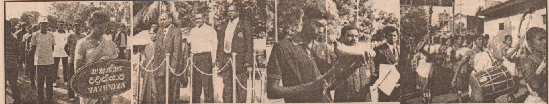
மாகாணமட்ட விளையாட்டுப் போட்டியின் ஆரம்ப நிகழ்விலிருந்து