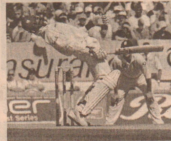
தது. தொடர்ந்து இரண்டாவது இனிங் சையும் ஆடிவரும் மேற்கிந்தியத்தீவு மதியபோசன

மேற்கிந்தியத்தீவு இங்கிலாந்து அணிகளுக்கிடையிலான நான்காவதும் இறுதியுமான டெஸ்ட் போட்டியின் மூன்றாம் நாளான நேற்று மேற்கிந்தியத்தீவு இன்னிங்ஸ் தோல்வியை வெல்வதற்காக கடுமையான போராட்டத்தில் ஈடுபட்டிருந்தது. முன்னதாக முதல் இனிங்சில் இங்கிலாந்து பெற்ற 470 ஓட்டங்களுக்கு பதிலளித்து ஆடிய மேற்கிந்தியத்தீவு முதல் இனிங்சில் 153 ஓட்டங்களுக்கு சகல விக் கெட்டுக்களையும் இழந்தது.