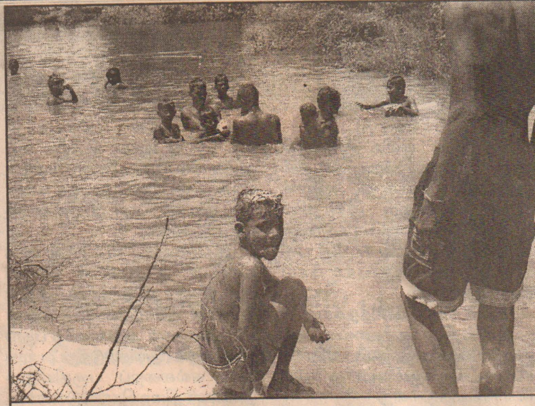
புதுக்குடியின்பில் கடும் வரட்சியால் கிணறுகளில் நீர் வற்றியுள்ளதால் சிறுவர் முதல் முதியோர் வரை புதுக்குடியின்பு கேம்பாம்புலவு வீதியில் பேராற்றில் குளியலகையே யடத்தில் காண்கின்றீர்கள். (யாழ்ப்பாணம்-தவராணம்)