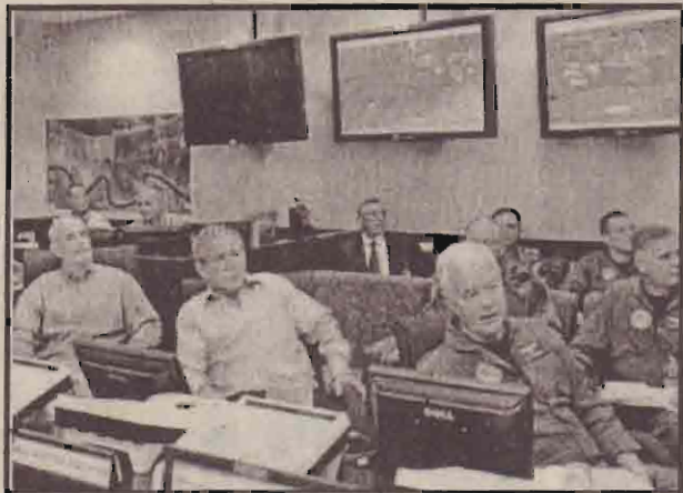
நீற்றா சூறாவளியின் சீற்றத்தைத் தொலைக்காட்சியில் நேரடியாக அவதானிக்கும் அமெரிக்க சனாதிபதி ஜார்ஜ் புஷ்

கற்றிணா சூறாவளியால் காப்புறுதி செய்யப்பட்டிருந்த பொருட்களின் மதிப்பை விட நீற்றாவால் ஏற்பட்ட சேதம் குறைவு என்று நியூயோர்க்கை சேர்ந்த காப்புறுதி நிறுவனங்கள் தெரிவித்துள்ளன. நீற்றா சூறாவளியால் மூன்று முதல் ஆறு பில்லியன் டொலர் வரையில் சேதம் அடைந்திருக்கலாம் என்றும் கற்றிணாவால் 40 பில்லியன் டொலர் முதல் 60 பில்லியன் டொலர் வரையிலான சேதம் ஏற்பட்டுள்ளதாக தெரிவித்துள்ளனர்.