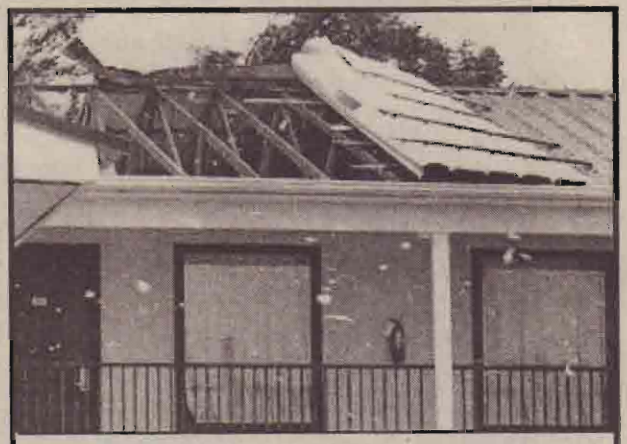
நீற்றா சூறாவளியினால் கட்டடத்தின் மூன்று கூரை சதைவடைந்திருக்கும் காட்சி.

இந்த மாதம் தொடக்கத்தில் நாபி என்ற புயல் வீசியதில் 20 இற்கும் மேற்பட்டோர் பலியானார்கள். தற்போது புதிய சூறாவளி ஐப்பானை அச்சுறுத்திக் கொண்டு இருக்கிறது.