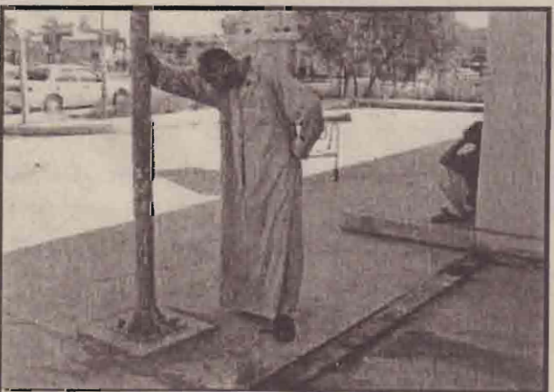
பாத்துத்துக்கு, 110 கிலோ மீற்றர் தொலைவிலுள்ள நுமாய் நகரில் நடந்த தும்பாக்கிச் சூட்டிச் சம்பவத்தில் பரியான மூன்று சகோதரர்களின் உடல்கள் வைக்கப்பட்டிருக்கும் வைத்திய சாலை முன்பாக கதூர்ப்பூம் உறுவினர்கள்

விலக்குகள் பாதுகாப்பு சங்கங்கள் மேற் கொண்ட முயற்சியின் பயனாக இந்த முடிவு எடுக்கப்பட்டுள்ளது.