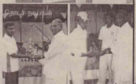
தொடர் நாயகன் அட்டாரகைகள்