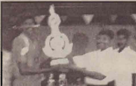
கரப்பந்துப் போட்டியில் முதலிடம் பெற்ற கிருஸ்ணபாரதி அணி