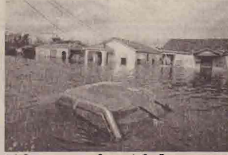
கற்றிணா சூறாவளி தாக்கியபோது ஏராளமானவர்கள் உயிர் இழந்தனர். இப்போது உயிர்ச் சேதம் அதிகம் ஏற்படவில்லை.

நீற்றா சூறாவளி தாக்கியதில் டெக்சாஸ், லூசியானா மாகாணங்களில் ரூ.23 ஆயிரம் கோடிக்கு மேல் இழப்பு ஏற்பட்டுள்ளது ஆனால்