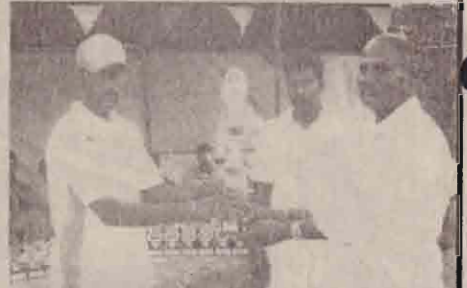
மென்பந்துப் போட்டியில் இரண்டாம் இடம் பெற்ற தோழர்கள் அணி