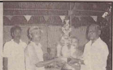
மென்பந்துப் போட்டியில் முதலிடம் பெற்ற இளந்தாரகை அணி