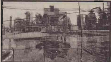
நேற்று முன்தினம் அமெரிக்காவின் டெக்சாஸ் கரையைநீற்றா சூறாவளி தாக்கியதுடன் அங்கு ஏற்பட்ட பெருவெள்ளத்தினால் வெளி ரா துறைமுகத்தில் பாதிப்பற்ற எர்பொருள் சுத்திகரிப்பு நிலையத்தை அவதானிக்கும் தொழிலாளர்கள்.

மீட்பு பணிகள் இப்போது முழு வீச்சில் நடைபெற்று வருகின்றன. டெக்சாஸ் மாநிலத்தில் வீடுகளை விட்டு பொதுமக்கள் வெளியே வர வேண்டாம். வெள்ள அபாயம் இன்னும் முழுமையாக நீங்கவில்லை என்று மாகாண நிர்வாகம் எச்சரிக்கை விடுத்துள்ளது.