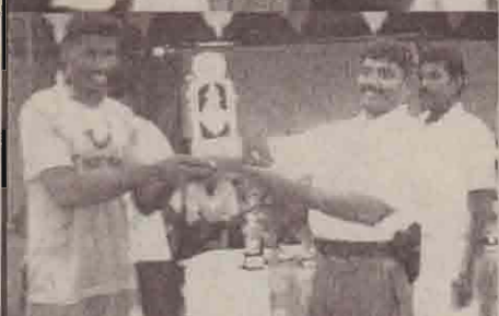
கரப்பந்துப் போட்டியில் இரண்டாம் இடம் பெற்ற இளந்தாரகை அணி