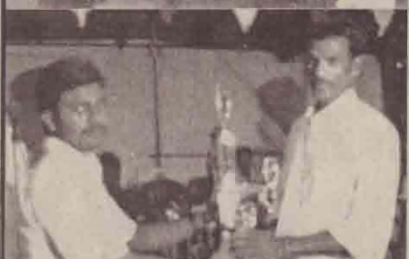
புப்பந்தாட்ட ஒத்தொன்று போட்டியில் முதலிடம் பெற்ற தர்சன் அணி